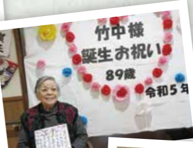
竹中様 誕生お祝い 89歳 令和5年