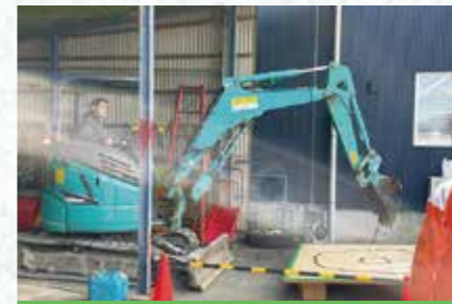
ユンボでお絵かき