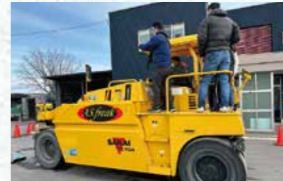
タイヤローラーアトラクション

終了後は子ども達へのプレゼントまで頂き、大人も子どもも大満足の体験会となりました☆