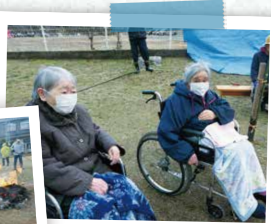
外のイベント 気持ちがいいですね♪

1月15日松島出身のお二人が、松島地区のどんど焼きに参加さ れました。昔なじみの知り合いの方との久しぶりの再会に、とても喜 んでおられました。