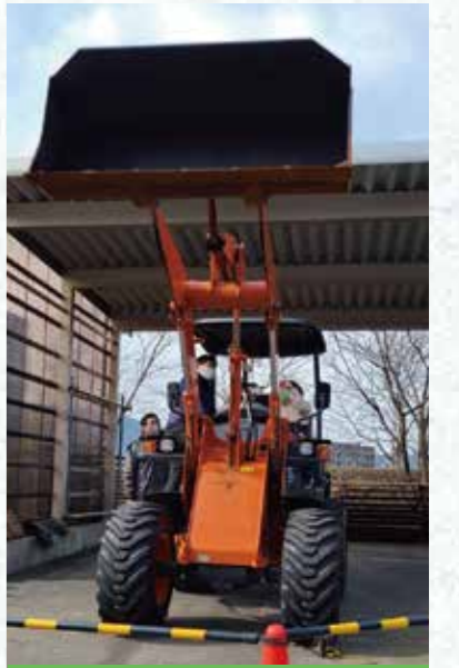
ミニショベル乗車体験