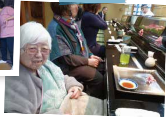
思い出のお寿司屋さんです♪

3月は、お二人の方の思い出の場所への外出です。 久しぶりに実家へ帰宅し、ご親類の方と再会されました。 そして、ご主人とよく通っていた行きつけのお寿司屋さんへの外食です。 ご家族様も同席いただき、誕生日を祝っていただきました。