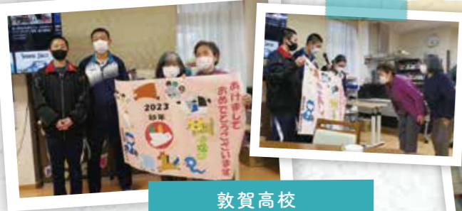
敦賀高校 家庭科クラブの皆さん