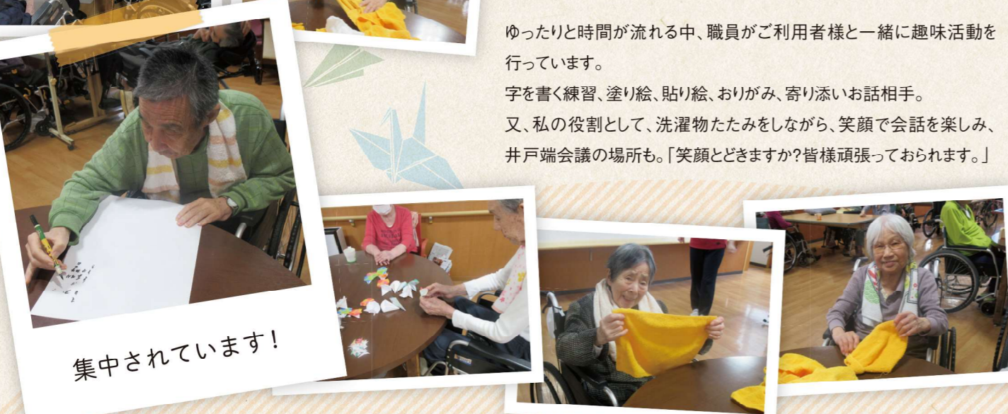
集中されています！

ゆったりと時間が流れる中、職員がご利用者様と一緒に趣味活動を行っています。 字を書く練習、塗り絵、貼り絵、おりがみ、寄り添いお話相手。 又、私の役割として、洗濯物たたみをしながら、笑顔で会話を楽しみ、井戸端会議の場所も。「笑顔とどきますか？皆様頑張っておられます。」