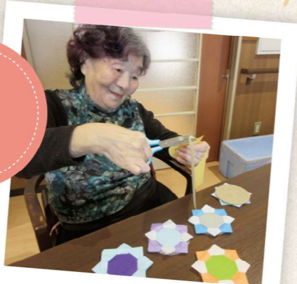
6月8日 運動会に向けての準備