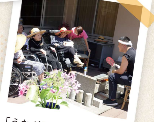
「うなぎ屋慎ちゃん」開店！

毎年恒例「土用のうなぎの日」今年は猛暑になりそう。と予測して、夏バテ防止対策。中庭を「うなぎ屋慎ちゃん」と名付けて開店。店主は鉢巻きまいて、赤うちわ。暑さの中、笑顔いっぱいのサービスに加え、パフォーマンスを交えながら、焼き続ける事2時間半。心地いい炭の香りと、甘い