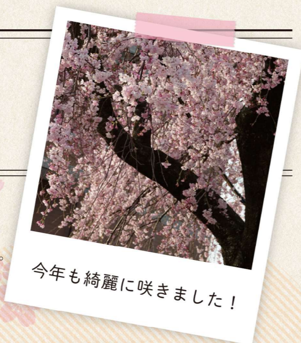
今年も綺麗に咲きました！

4月、桜の季節となり、当地自慢の枝垂桜が綺麗に咲き、春風に揺れています。桜といえばお花見。今年は「一品処溪山荘」として楽しんで頂きました。メニューは、おでん、焼き鳥、枝豆、フランクフルト、カップ麺 又、来店時には「お・も・て・な・し」として、桜湯・練切も召し上がって頂き、春を感じて頂きました。