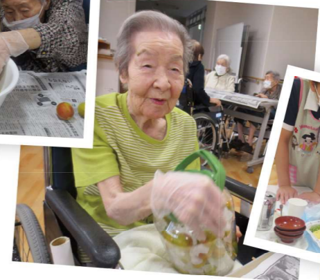
どんな味になるかしら♪