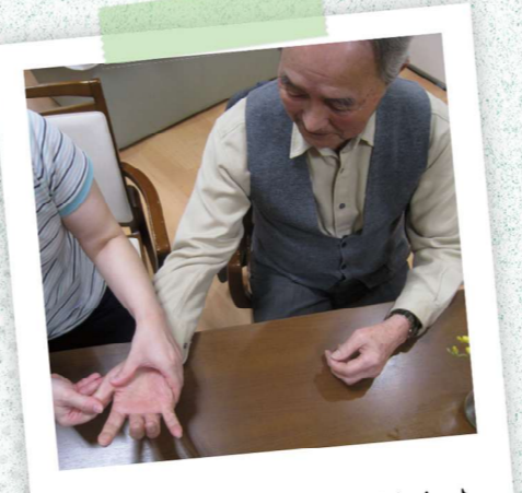
ほぐされていい気持ち!