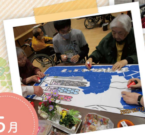
鯉のぼり貼り絵作成