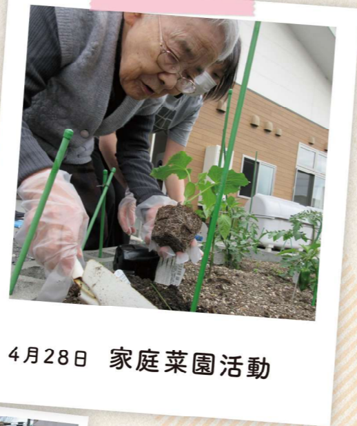
4月28日 家庭菜園活動