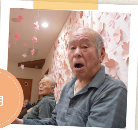
手作りで満開の桜!

4月は廊下の壁に桜の花びらを皆様と一緒に手作りして、お花見の環境を整えました。天気が良かったので、外にも散歩に行きました。気分転換になったと大変喜んでいただくことができました。