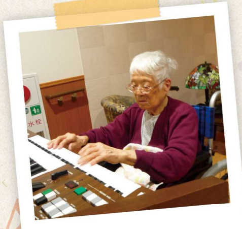
これには拍手喝采!