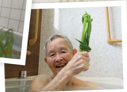
5月5日～ 菖蒲湯に入りました