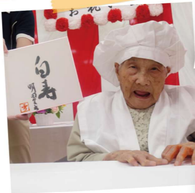
おめでとうございます!