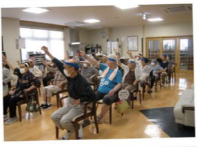
あおぞらサーカス団

赤組、青組、白組に分かれて白熱した運動会が行われました。今回の優勝は...赤組!!