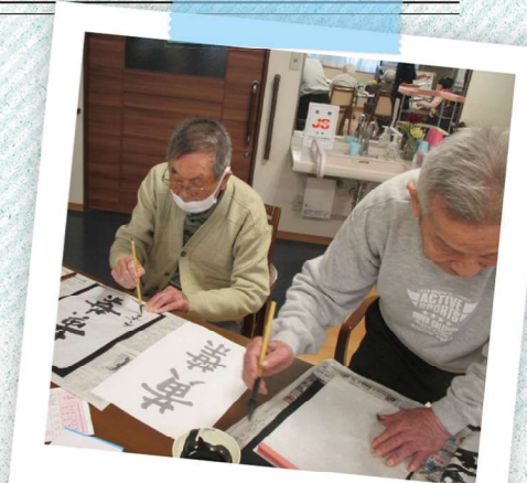
気が引き締まります

年度初め。新たな出会いもあり、心を新たに真剣に取り組まれている様子でした。今年度はコロナ禍の中での始まりですが、感染対策を万全に、楽しんでいただけるよう、工夫を凝らして取り組んでいきます!