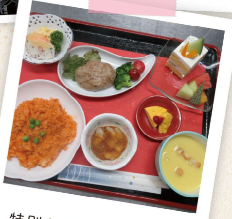
特別な豪華メニュー！

お誕生日お祝い膳として皆様に召し上がって頂きました。溪山荘の踊り子隊「シスターズ」も飛び入り参加。敦賀の舞、敦賀とてもすきすきを可憐な太鼓に合わせ披露。施設長による「乾杯」の音頭。ビールがとても冷えて美味しかったご様子でした。