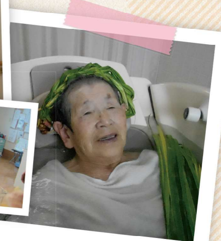
全身をリラックス!