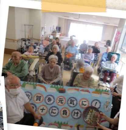
コロナに負けない!