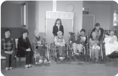
11/24 誕生会 職員によるマジックショーを開催しま した。驚きの連続でした!!