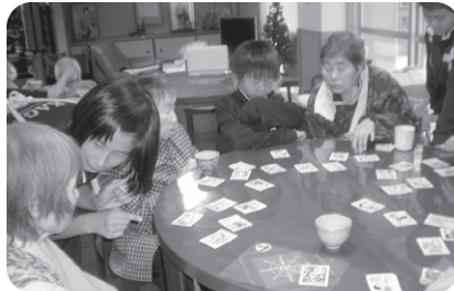
11/25・30 中郷小学校友愛訪問 娘時代を思い出しながら昔の遊びを 楽しみました。