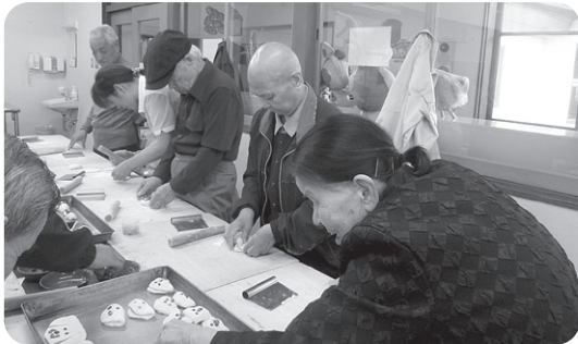
11月5日 秋レク「ラポーゼかわだ」でパン作り体験 パン生地と格闘!!