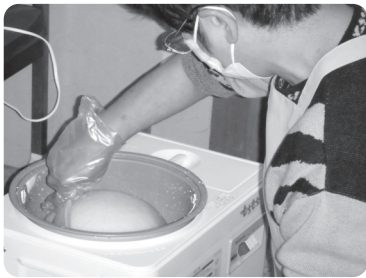
今年のもちつきは機械でついたもちを...