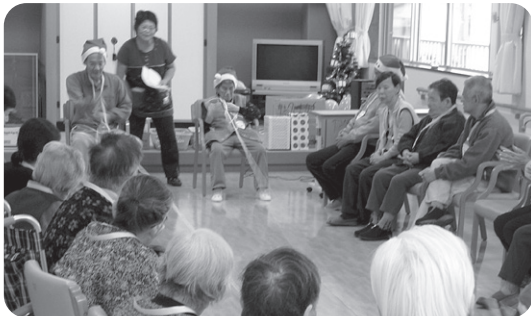
12月16日 クリスマス会兼忘年会 みんなでゲーム それ引けワッショイ!!