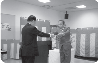
10/11 溪山荘改修工事完成披露祝賀会 皆様、大変お疲れ様でした。胸いっぱい の祝賀会でした。