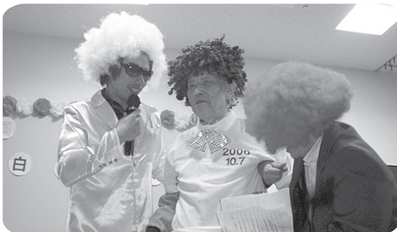
溪山荘紅白歌合戦 12月