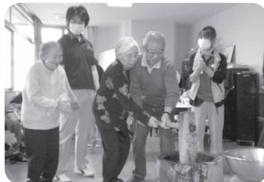
12/28 餅つき 皆さんの力で、おいしい餅がつきあ がりました。