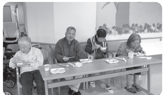
搗きたてのおもちはどれもおいしかったです! 館もち きなこ おろしもち!!!