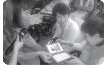
10/24 誕生会 秋の味覚の「栗ケーキ」プレゼントさ せて頂きました。