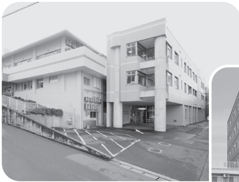
▲ 溪 山 荘