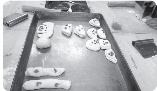
同じくパン作り かわいい生地が並びました。 どんなパンになるのかな?