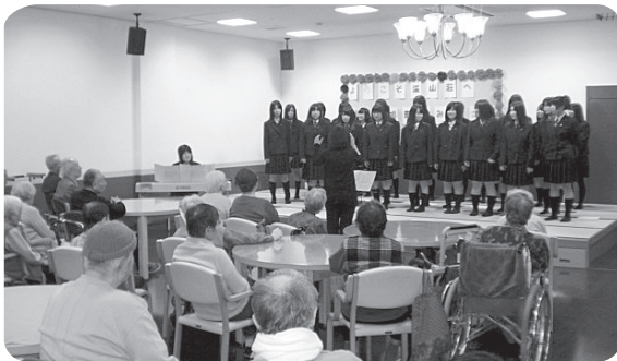
敦賀高校合唱部友愛訪問 11月

福祉演芸会での三味線演奏。 皆さん、威勢のよい三味線の演奏に聞き入っておられました。