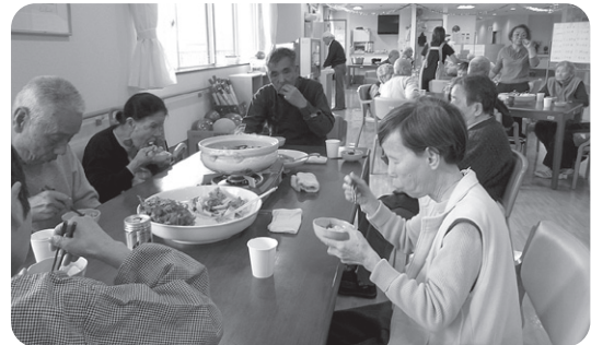
プレゼントやゲームの後は おいしい鍋でした!!