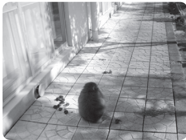
一生懸命作った干し柿は猿も山から降りてくるうまさ!