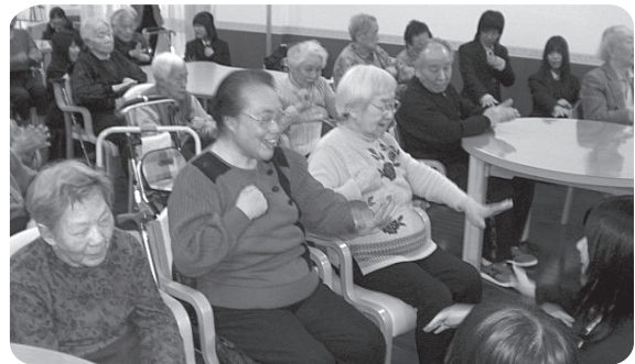
敦賀高校合唱部友愛訪問 11月

敦賀高校合唱部を招いてのコンサート。 素敵なるハーモニーに耳を傾けておられました。