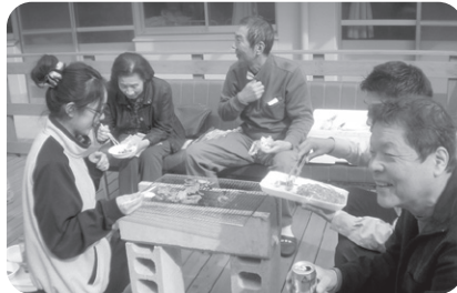
11/13 家族の会BBQ お肉にラーメンに焼そばに家族の皆さ んと楽しみました。