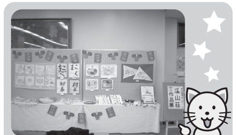
12/20~1/7 福井銀行敦賀支店 溪山荘展示会をさせて頂きました。