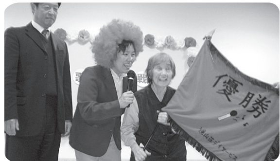
溪山荘紅白歌合戦 12月