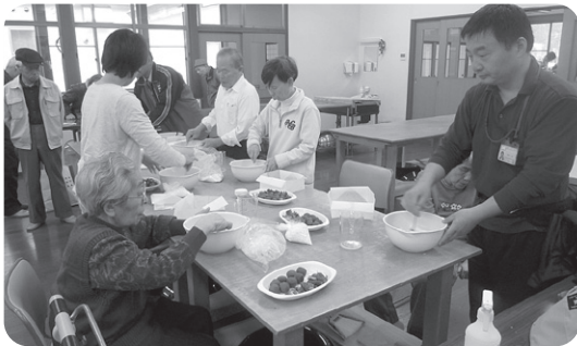
いちご大福にも挑戦!!