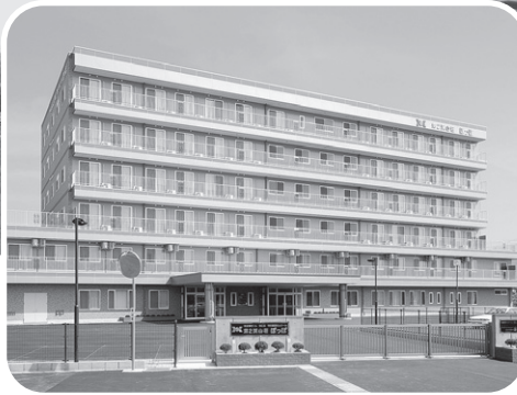
第2 溪山荘 ぽっぽ