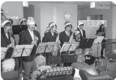
12/24 クリスマス会 敦賀工業高校ブラスバンド部による クリスマスコンサートをして頂きました。