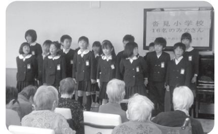
11/16 杵見小学校友愛訪問