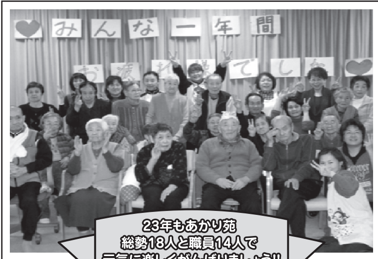
23年もあかり苑 総勢18人と職員14人で 元気に楽しくがんばりましょう!!