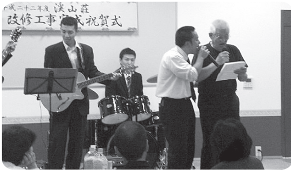
改修工事記念式典 10月

日ごろは、溪山荘デイサービスセンターをご利用、ご支援を賜りありがとうございます。 改修工事も終わり、新しい設備に伴い、さらに満足していただけるようなサービス提供に職員一同努めていきたいと思っております。本年もよろしくお願い致します。