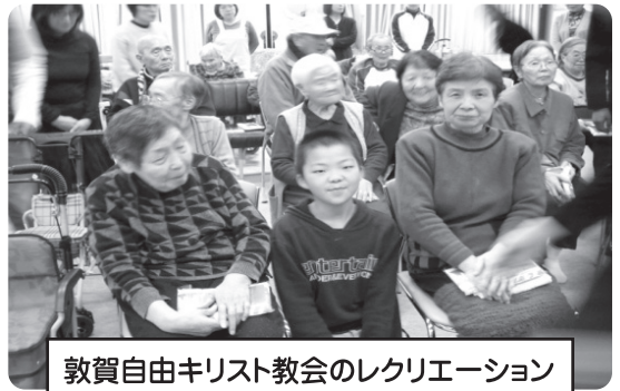
敦賀自由キリスト教会のレクリエーション 元気な子が盛り上げてくれました。