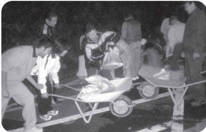
11/12 夜間防災訓練 地区の皆さんと一緒に土のう作りを体 験しました。