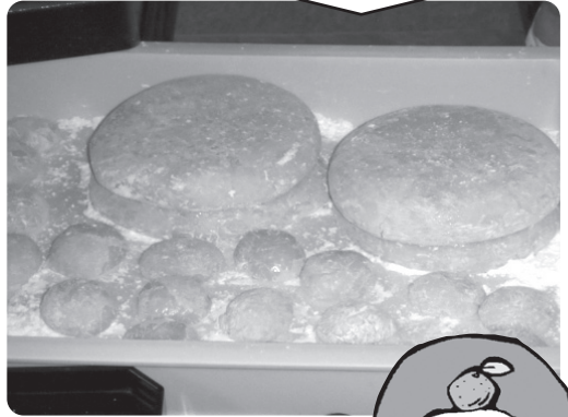
よいお正月が 迎えられそうです。