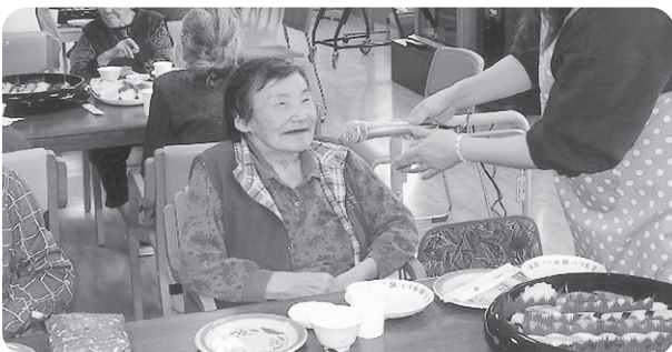
12月23日 「萩の苑クリスマス会」を開催 美味しいごちそうを前に思わずお顔がほころびマス!!!