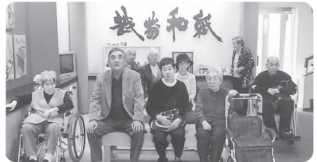
11月9日 「越前和紙の里」へ萩のレクリエーション 「和紙会館」でハイ!!! パチリ