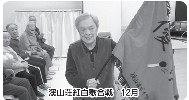
溪山荘紅白歌合戦 12月