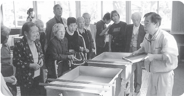
「紙漉き教室」を始めます!!! みなさん真剣ですよ