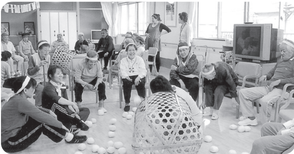
10月30日 「萩の苑大運動会」を開催 玉入れ競争のワンシーン 赤勝て!!! 白勝て!!!