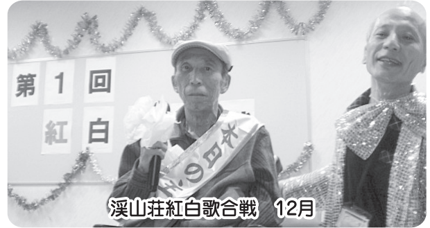
溪山荘紅白歌合戦 12月

秋の旅行で滋賀県の「マキノピックランド」へ行きました。 かわいい羊に出会いました。