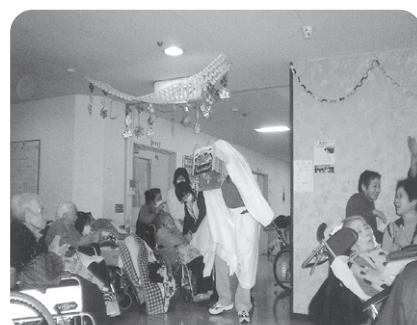
1月6日 新年会 白シマイの登場?! 今年も良い年でありますように...