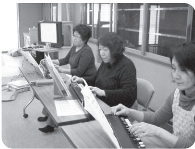
あかり苑大正琴ユニット「おこと姫」たちの演奏とおどり