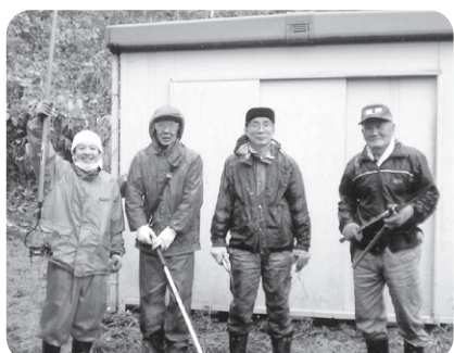
12月5日 家族の会清掃活動 溪山荘がピッカピッカになりました。