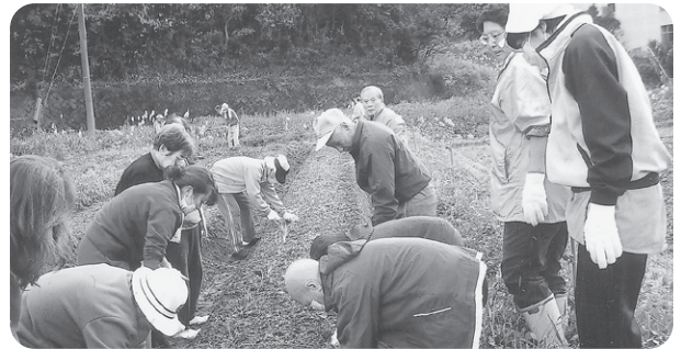
12月2日 高野において畑作業に従事「ネギ苗」を植えました。 今年は野菜をたっぷりと作りますヨ!!!