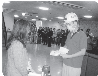
11月9日 夜間避難訓練 みんなが無事に避難できるように訓練しています。