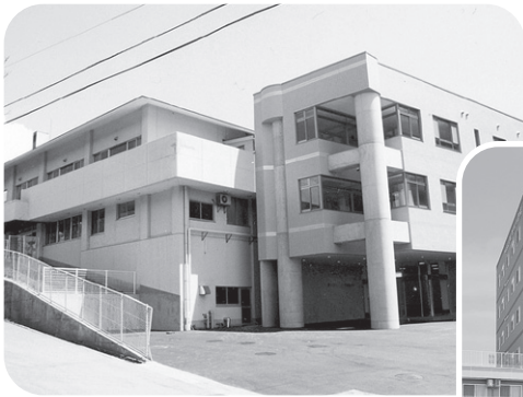
▲ 溪 山 荘