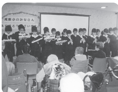
12月8日 咸新小友愛訪問 とても素敵な演奏をありがとうございました。