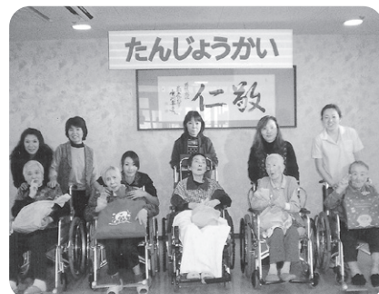
11月26日 11月誕生会 おめでとう!これからも長生きし ましょう!ピースピース