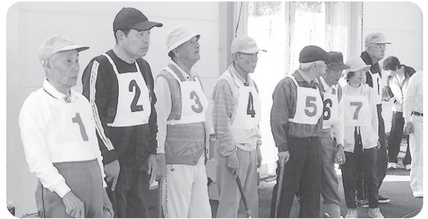
選手一同勢揃い!!! 試合開始前の緊張の一瞬です。