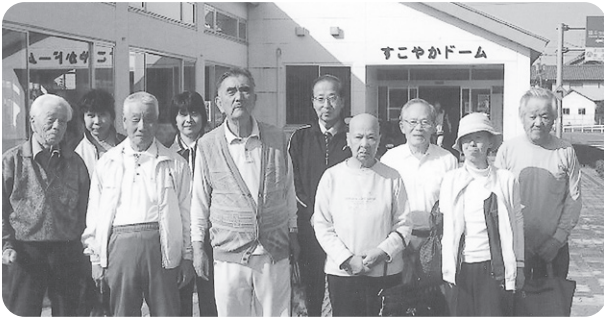
10月14日 福井県養護老人ホームゲートボール大会に初出場 見事1回戦を突破!!! 会場前での記念写真です。