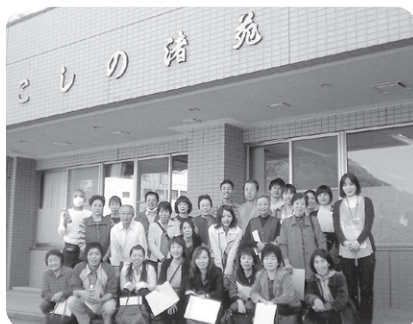
11月7日 家族の会研修旅行 こしの渚苑の見学とカニを食べて きましたー♪