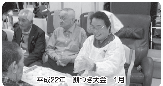
平成22年 餅つき大会 1月