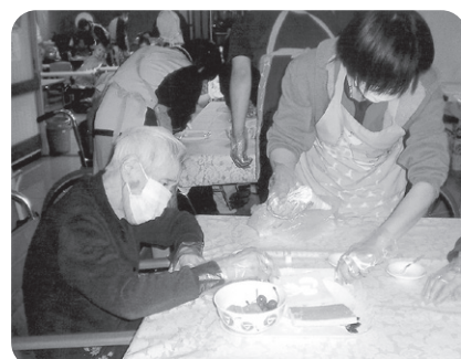
12月16日 クリスマス会 クリスマスケーキを作りました。自分で 作ったケーキは特別オイシー!!!