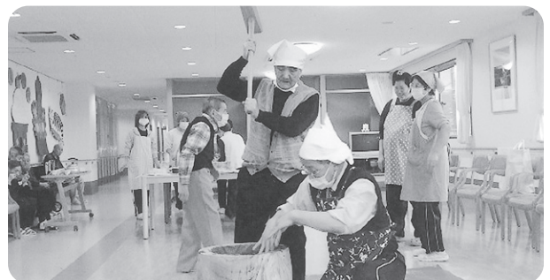
12月28日 「餅つき大会」を実施 美味しいお餅が出来上がりました。