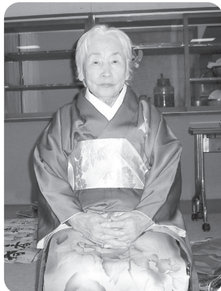
女性群は、晴れ着をきてぱちり!