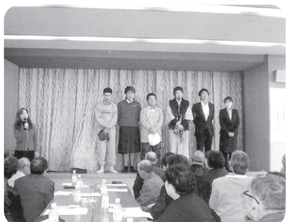
11月12日 KEIJINバンド 今年もたくさんの場所で演奏して いきます♪お願いします!!