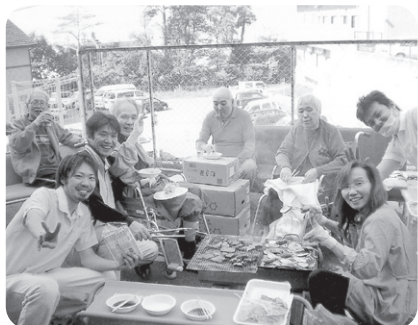
10月31日 家族の会BBQ大会 とっても楽しそう!!お腹いっぱいになりました。