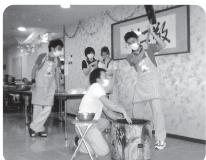
12月28日 餅つき ペタン・ペタン、つきたてのお 餅は柔らかくて美味しいね!!