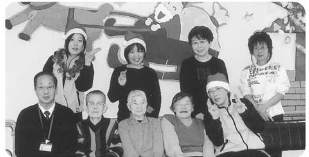
12月に誕生日を迎えた3名のみなさんと記念写真です。 ハイピース!!! おめでとうございます。