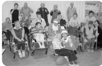
最後に全員で記念撮影。皆様、笑顔でピースです。