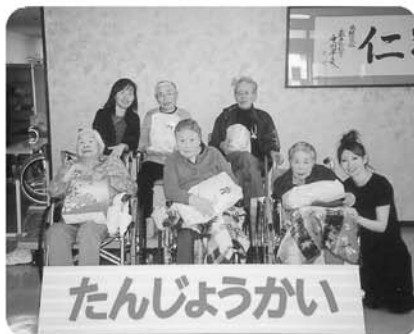
12月3日 12月の誕生日会、プレゼントうれしいね!!