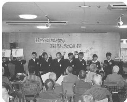
11月7日 沓見小学校3年生の友愛訪問です。