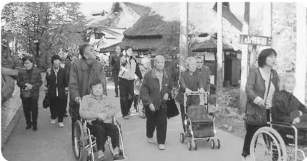
11月12日 秋の外出で「石川県小松市、ゆのくにの森」へ出かけました。園内の散策風景です。