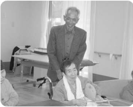
お誕生日に家族の方もいらっしゃってみんなでお祝いをしました。