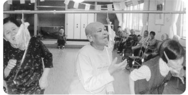
パン食い競争です!!! フレー、フレー、手を使ってはダメですよ!!!