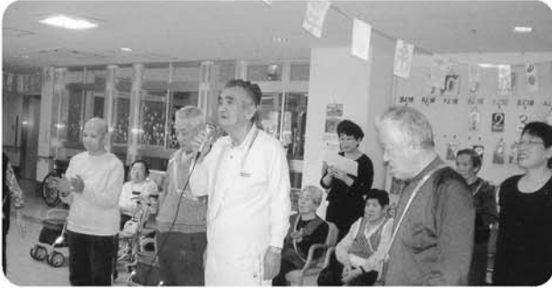
10月13日 萩の苑「大運動会」を開催しました。 選手代表「選手宣誓」です。