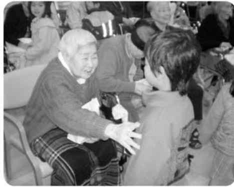
かわいいサンタさんが訪問してくれました。