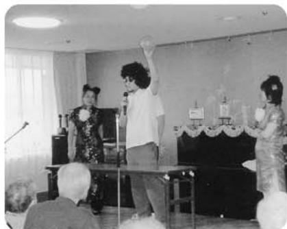
11月29日 速演芸会、「スーパー手品」ハイッ!!