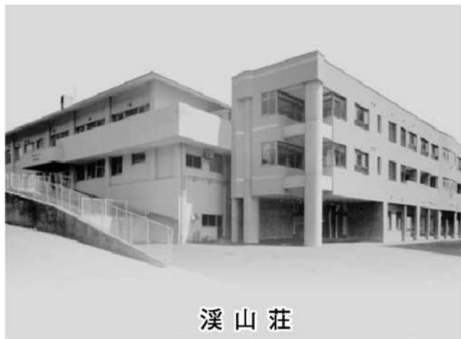
溪 山 荘