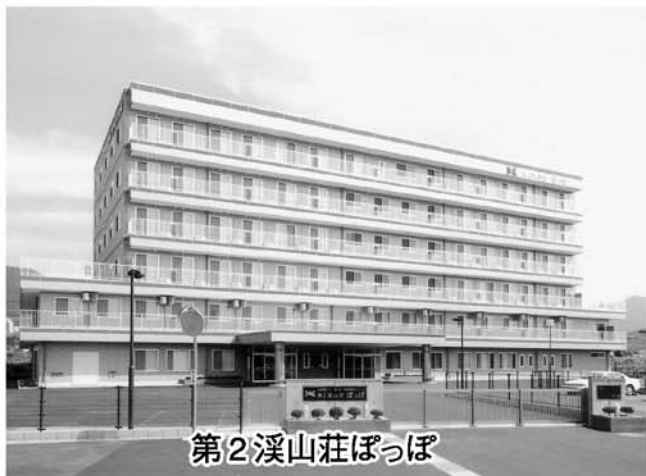
第2 溪山荘 ぼっぼ