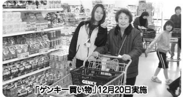
「ゲンキー買い物」12月20日実施

毎回買い物に参加される方は、外出することの不安が解消され、在宅での生活に生きています。