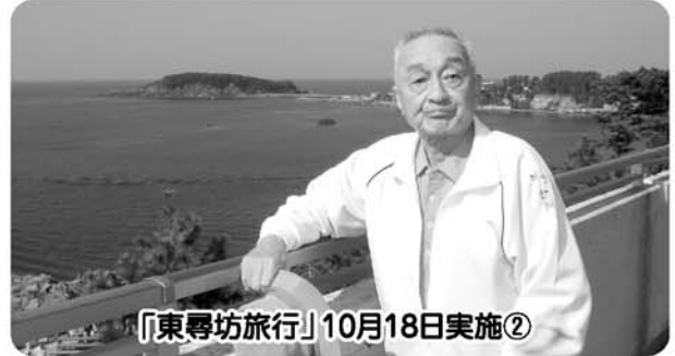
「東尋坊旅行」10月18日実施②

昔から旅行を趣味にされておられ、昔と全く変わってないなと当時を振り返っておられました。