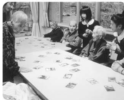
12月5日・9日 中郷小学校6年生友愛訪問、かるた取り。どれかな～!