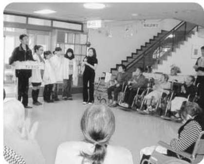
12月7日 東郷地区子供会から「お餅」をいただきました。ありがとう!!