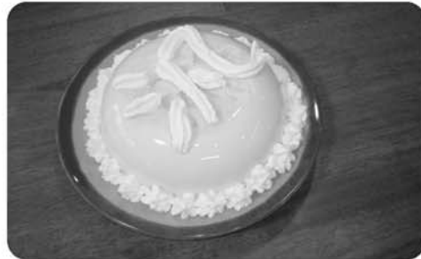
12月生まれの方の誕生日会を6階の皆様でお祝いしました。 炊飯器の釜でプリンを作り、皆様で食べました。とてもおいしく食べごたえがありました。