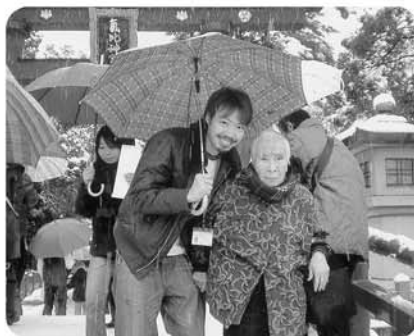
1月1日 氣比神宮に初詣! 雪が降って寒かった～!!