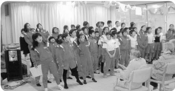
11月25日 松原小学校4年生の児童のみなさん58名の方がお尋ね下さいました。歌に踊りに楽しいひと時を過ごしました。ありがとうございました。