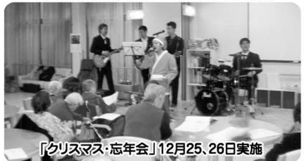
「クリスマス・忘年会」12月25、26日実施

利用者主体でもちつきを行いました。みなさんにいろいろと教わり、いい社会勉強になりました。