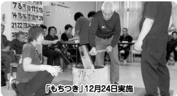
「もちつき」12月24日実施

毎回買い物に参加される方は、外出することの不安が解消され、在宅での生活に生きています。