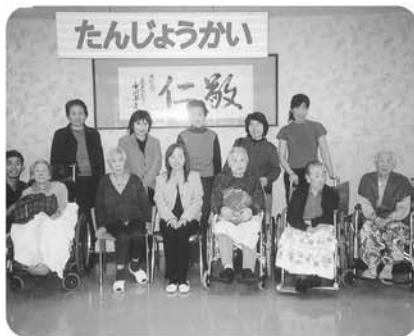
11月18日 11月の誕生日会、おすましでおめでとぅ!!