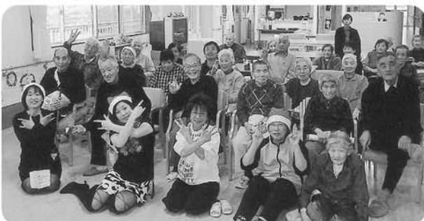
12月25日 クリスマスの集いを開催 一同!!! ハイ、ポーズ!!!