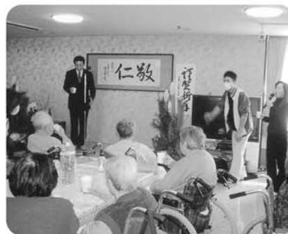
1月7日 新年会! おめでとうございます。カンパ～!!