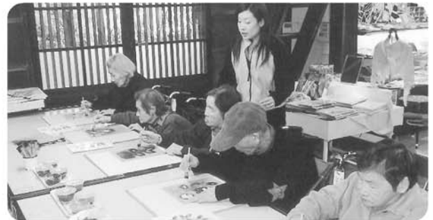
「友禅の館」にて【ハンカチ染め】に挑戦!!! みなさん真剣ですよ!!!