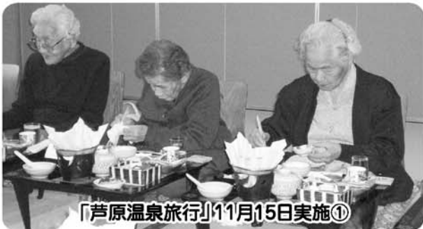
「芦原温泉旅行」11月15日実施①

昔から旅行を趣味にされておられ、昔と全く変わってないなと当時を振り返っておられました。