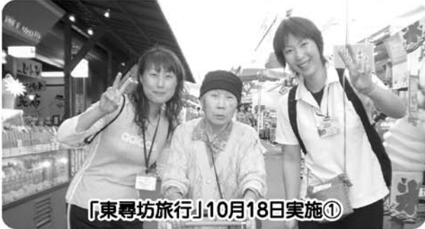
「東尋坊旅行」10月18日実施①

日ごろは、溪山荘デイサービスセンターをご利用、ご支援を賜りありがとうございます。 今年、職員のメンバーも大幅に変わりましたが、去年以上に進化したデイサービスにしていきたいと職員一同意気込んでおります。今年もよろしく願い致します。