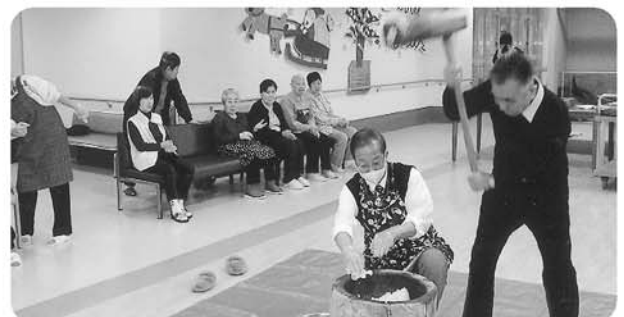
12月26日 餅つき大会を開催!! ペッタン、ペッタン!! 美味しいお餅が出来上がりました。