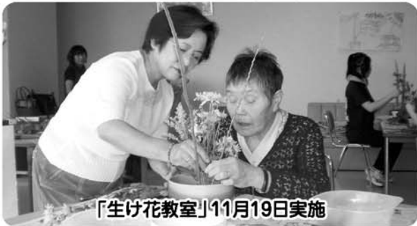
「生け花教室」11月19日実施