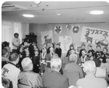
12月18日 忘年会・クリスマス会です。東郷保育園児によるクリスマスソング!