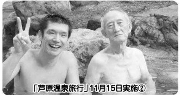
「芦原温泉旅行」11月15日実施②

デイサービス始めて以来の温泉旅行でした。最初は不安がありましたが大成功でした。また、行きたいです。