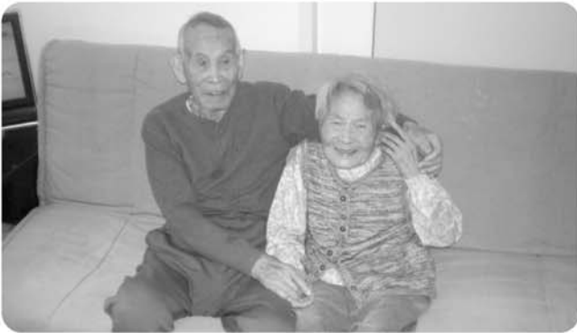
溪山荘にいらっしゃる旦那様に会いに行きました。 久しぶりで少し照れくさそうでしたが、二人とも嬉しそうにお話をされ楽しい時間を過ごされました。