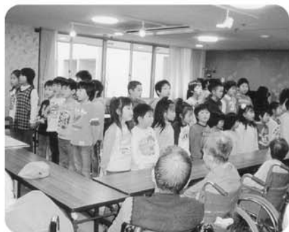
12月25日 黒河・第2粟野児童クラブ友愛訪問、元気に歌ってくれました。