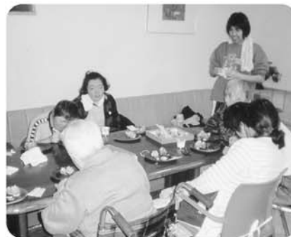
11月25日 太陽の家ボランティアとクリスマスリース作り。