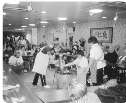
12月25日 餅つきです。ヨイショ～!! ペタンコ!!