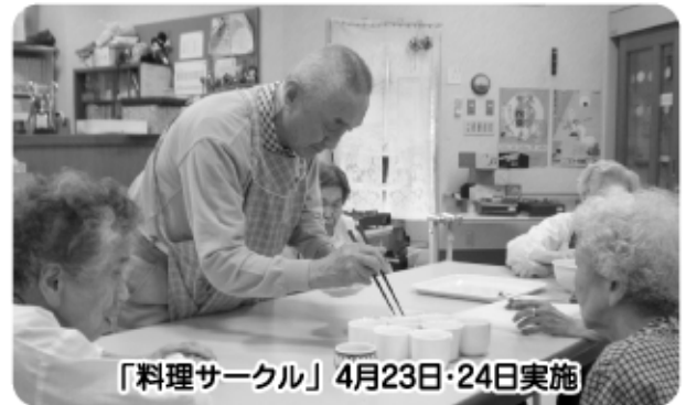
「料理サークル」4月23日・24日実施

3B体操の先生が訪問され、道具を使って楽しく運動です。これなら、楽に体を動かせるね。