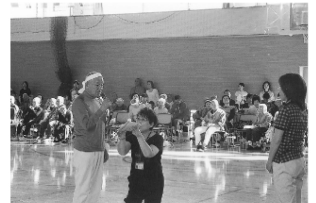
閉会宣言 “おつかれさまでした!!”