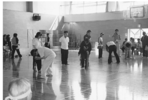
地球は回る目も回る “ソレー まわって!!まわって”