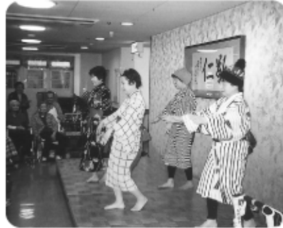
4月13日福井市仏教婦人会が来荘されました。何のおどりかな?