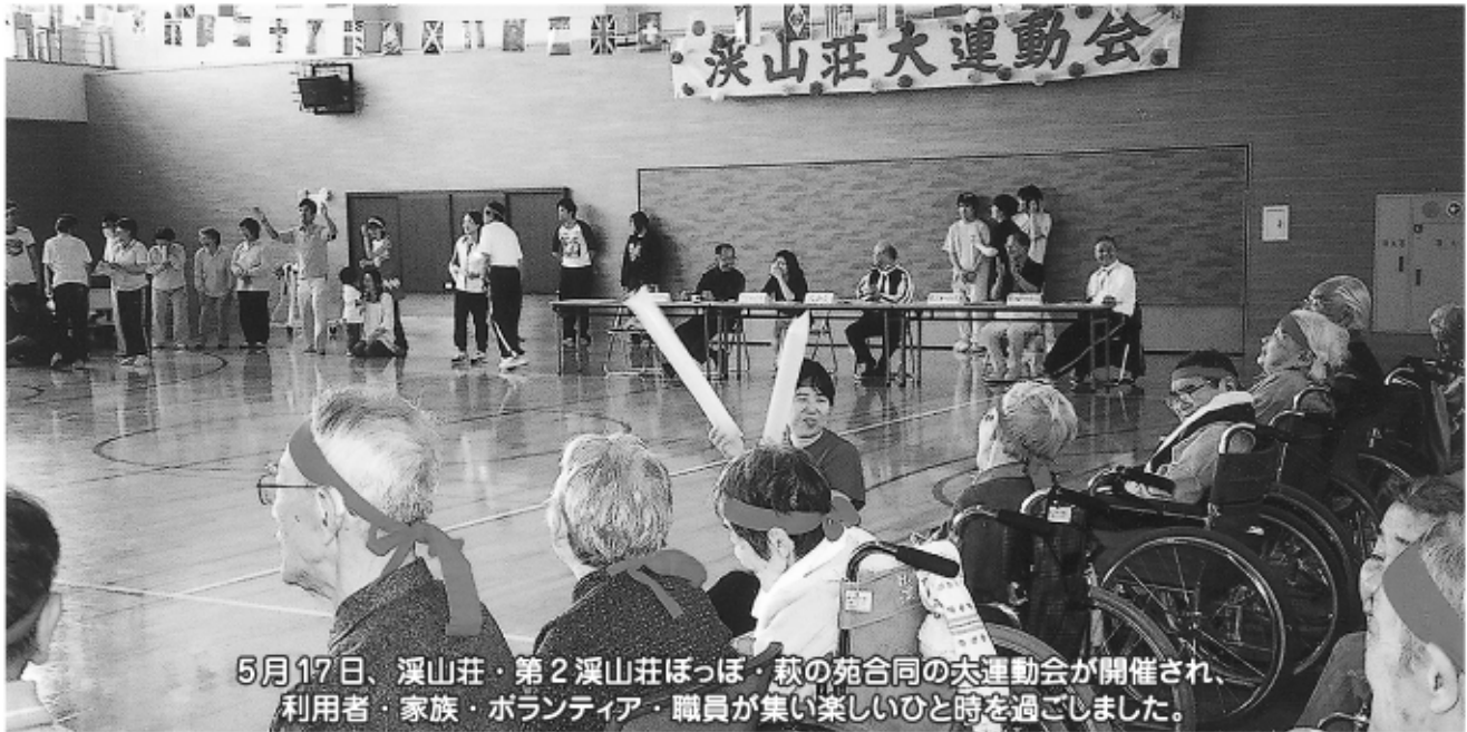
5月17日、溪山荘・第2 溪山荘ぽっぽ・萩の苑合同の大運動会が開催され、利用者・家族・ボランティア・職員が集い楽しいひと時を過ごしました。