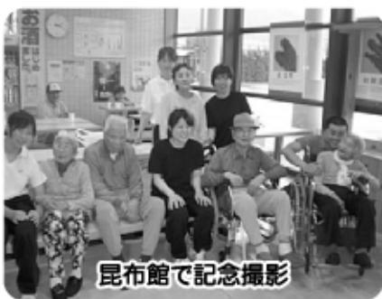
昆布館で記念撮影

ぼたんりんピング(ショートステイ)の日常の風景。真剣勝負を繰り広げていらっしゃいます。観客もおられ、プロも顔負けの好勝負をされていました。