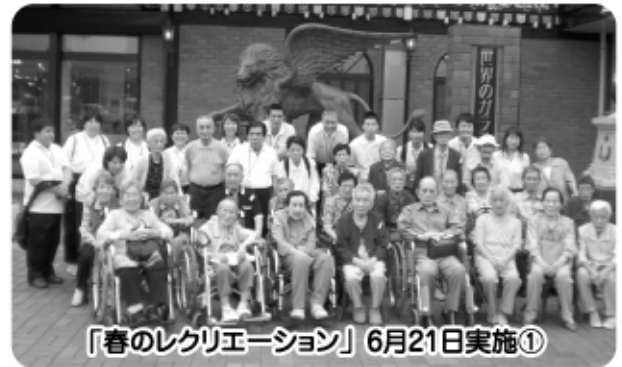
「春のレクリエーション」6月21日実施①