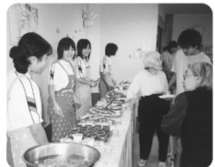
6月11日初めてのおやつバイキング 粟野中 社会体験学習生もお手伝い。