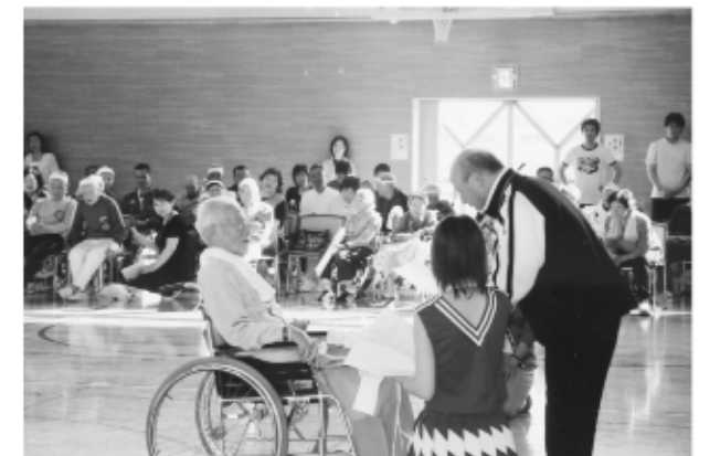
表彰状授与 “1位 白組 おめでとうございます!!”