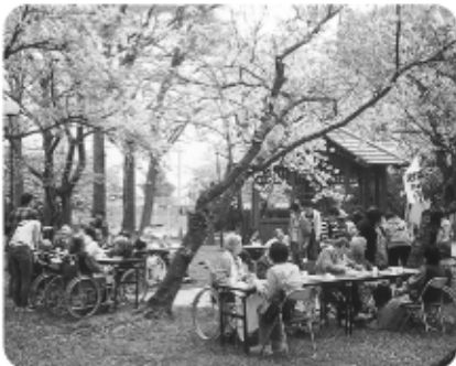
4月16日桜の下で昼食、格別な味がしました。