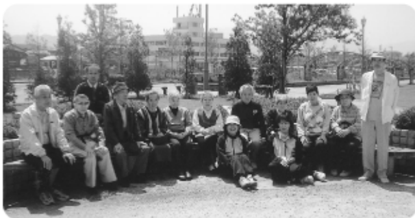
5月7日 敦賀港金ヶ崎緑地へ出かけました。「人道の港」で胸いっぱい潮風を吸い込み、記念写真です。