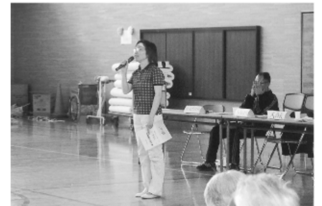
久保田施設長 閉会あいさつ