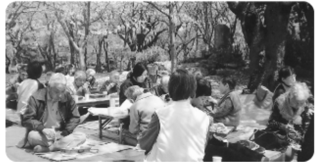
天候にも恵まれ豊公園の桜の下での「昼食風景」です。春の一日を満喫しました。