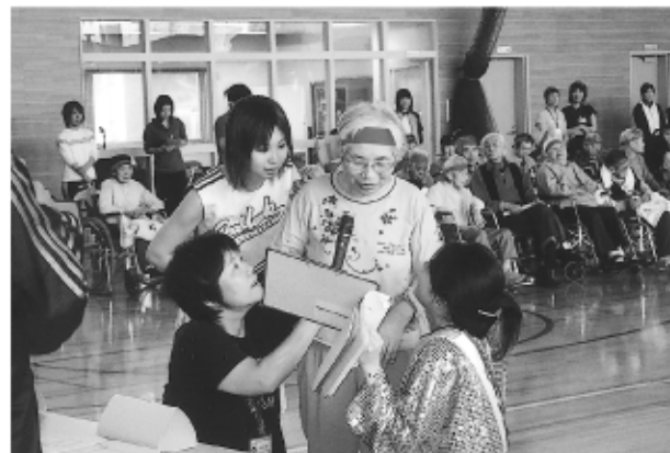
開会宣言 “開会を宣言します”