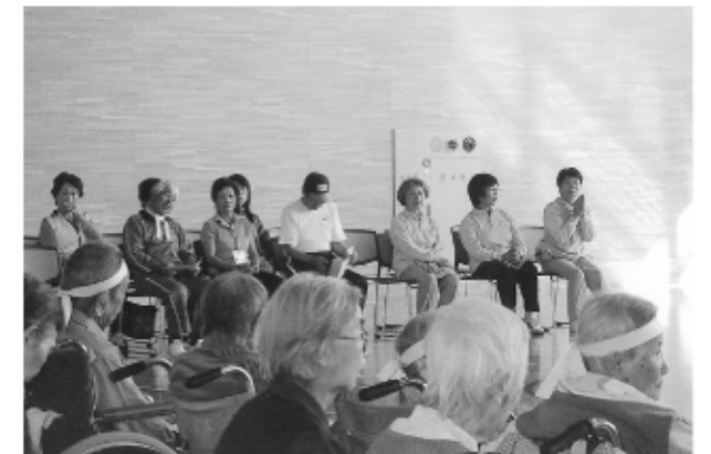
お手伝いいただきました、ボランティアの方々です。ありがとうございました。