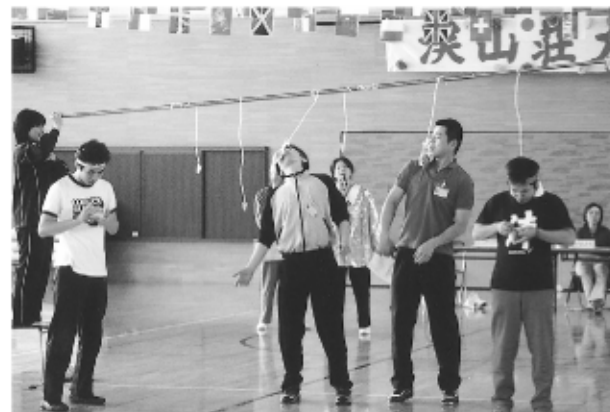
パン食い競争 “アーン ングング 難しい！”