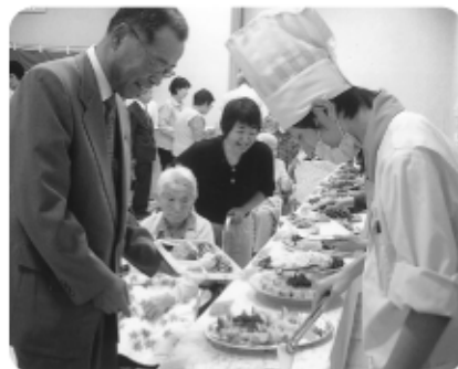
6月1日開所記念昼食会での「バイキング」 ウファー どれも美味しい そう!! みんな大喜び!!