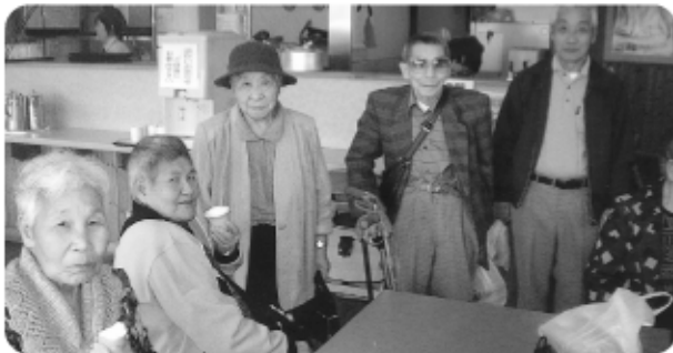
一掃り道一高島市マキノ町「道の駅」での休憩風景!!!ソフトクリームをバクリ!!!