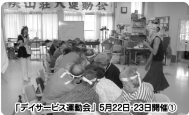
「デイサービス運動会」5月22日・23日開催①

お料理。これからは男の出番。黙って見ててくれ。でも、横からは「もっと細かく・・・」