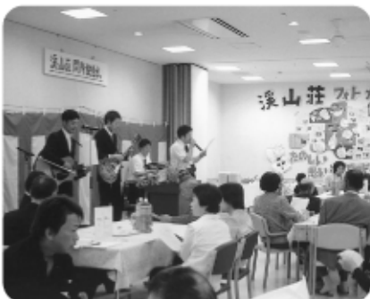
6月1日溪山荘開所記念式 KEIJINバンドのデビューです。 "テケテケテケ" イェーイ のってます。