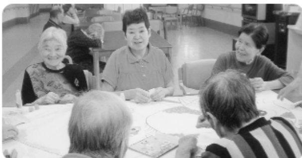
6月13日 貼り絵サークルの一コマです。皆さん楽しそうですネ!!!