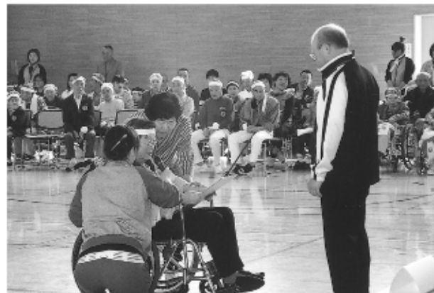
選手宣誓 “みんなで がんばります”