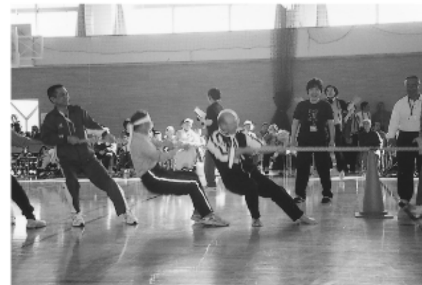
綱引き 赤組・白組 “よいしょ！よいしょ！”