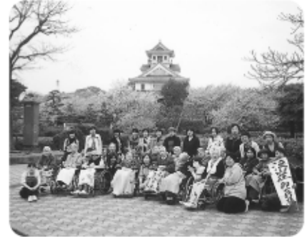
4月16日豊公園でのお花見、記念撮影です。ハイチーズ!!