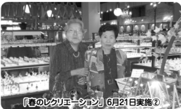
「春のレクリエーション」6月21日実施②