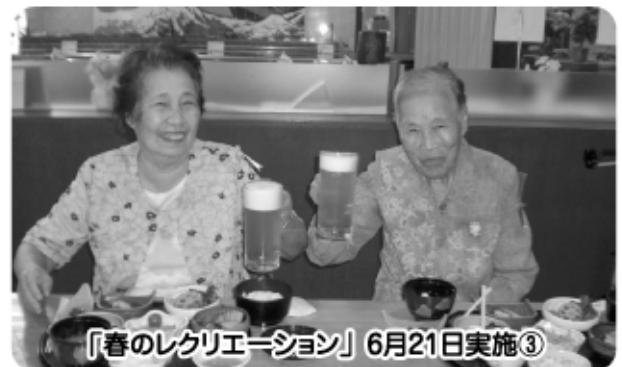
「春のレクリエーション」6月21日実施③