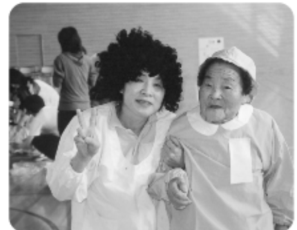
5月17日運動会のとびっきり笑顔で、肝っ玉母さん?!