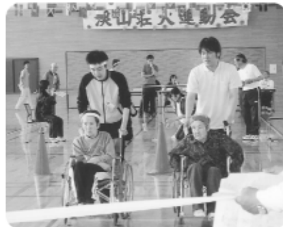
5月17日運動会の車椅子リレー、緊張の中にも早く来て。