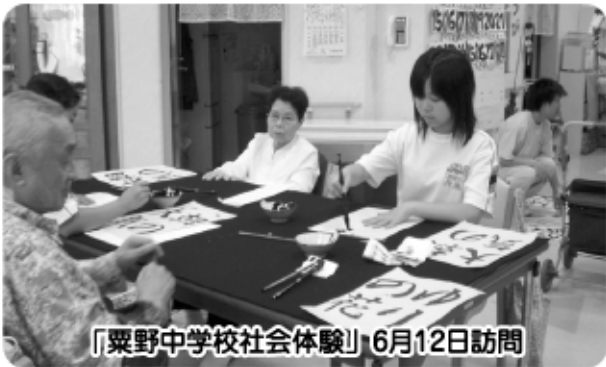
「粟野中学校社会体験」6月12日訪問