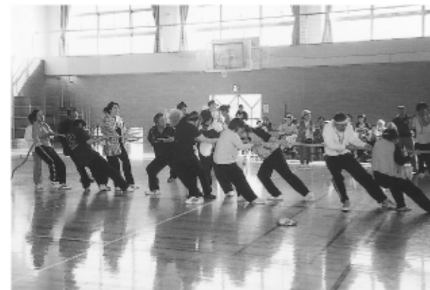
綱引き 青組・黄組 “なにくそ！負けるもんか！”