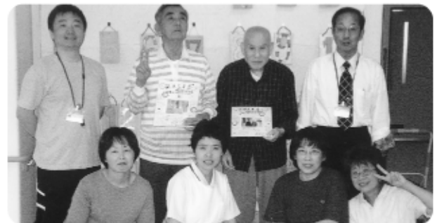
5月23日 5月生まれの方の誕生会を開催。お二人を囲み記念写真です!!!