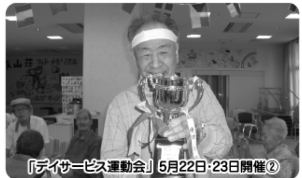
「デイサービス運動会」5月22日・23日開催②