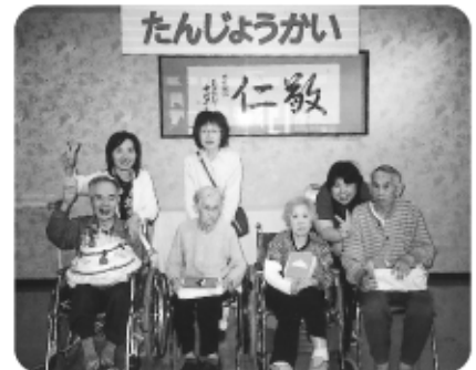
5月28日 5月度誕生会です。ピースピース!!