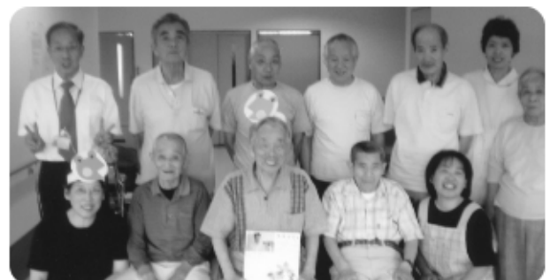
6月18日 6月生まれの方の誕生会を開催。誕生者を囲み記念写真です!!!