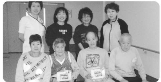
4月30日 4月生まれの方の誕生会を開催、お二人には写真入りメッセージカードをプレゼントしました。記念写真です!!!ハイパチリ!!!