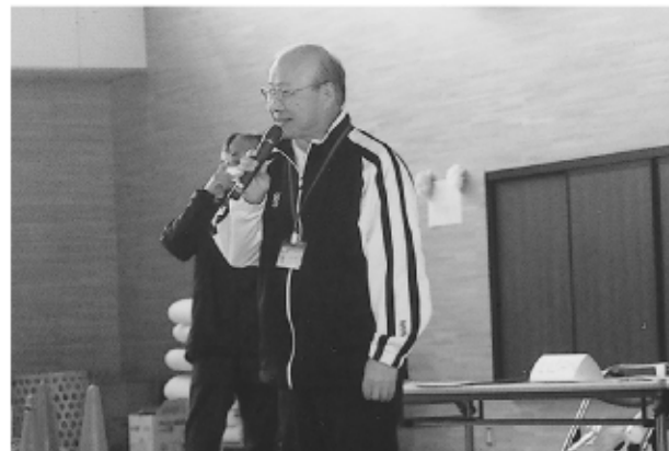
櫻井施設長 開会あいさつ