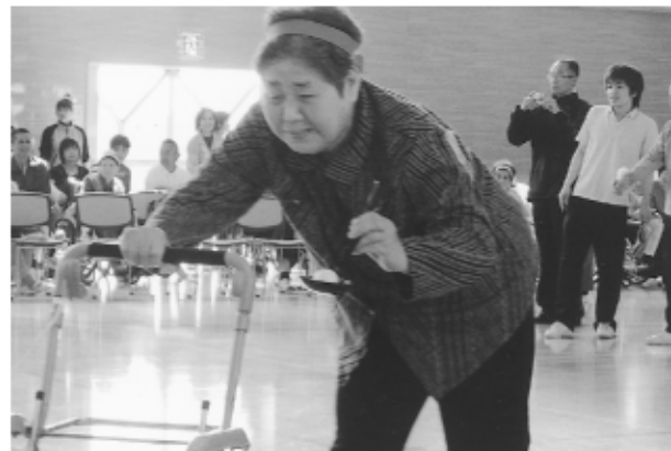
おたまりレー “お願い おちないでね！”