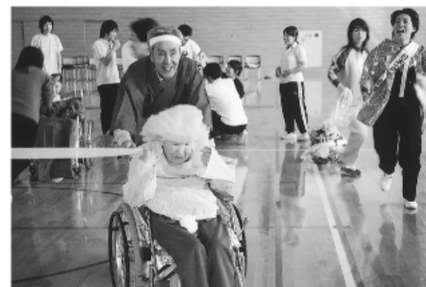
とびっきりの笑顔を下さい “ハイ ゴール 1等賞！”