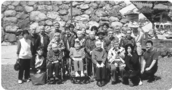
4月15日 長浜市豊公園へお花見に出かけました。長浜城をバックに記念写真です。ハイ!!!チーズ!!!