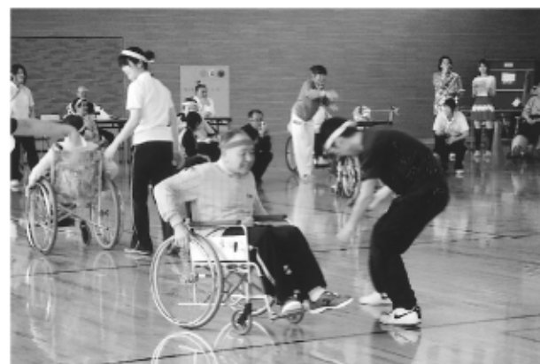
車椅子リレー “もっとこっち！こっち！”

5月17日、恒例の大運動会が、今年は第2溪山荘ぼっぼと萩の苑の合同にて、東郷コミュニセンタースポーツセンターにおいて盛大に開催されました。入居者141名、ボランティアの方々として教賀市介護相談員、民生児童委員、東郷地区婦人会、青池医療福祉専門学校生、IB医療福祉専門学校生のみなさん等17名、職員31名、ご家族32名の合計219名が参加。選手のみなさんは、赤組・白組・黄組・青組の四組に分かれ、