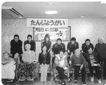
2月20日 誕生会を開催 2月生まれの方々の記念撮影です!!!