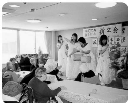
1月5日 新年会を開催 女子職員の華やかな踊りです!!! “銀座カンカン娘”