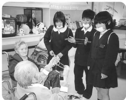
2月19日 中郷小学校児童のみなさん が福祉体験に来荘、入居者様と楽しい ひと時を過ごしていただきました。