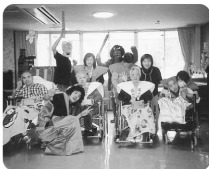
2月3日 “節分行事” 年男・年女のみなさんと赤鬼・青鬼 など勢ぞろい。