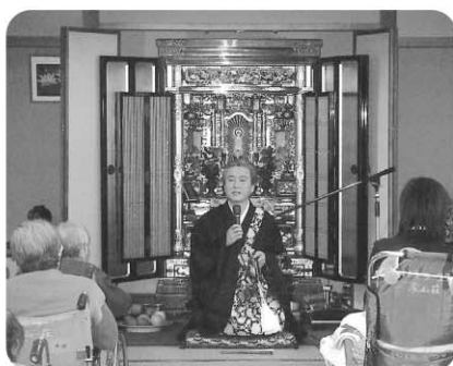
3月19日 「春の彼岸法要」で永覚 寺住職様のお話をお聞きいたしま した。