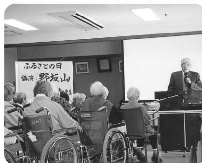
2月6日 “ふるさとの日行事” 「野坂山」の講演をお聞きしました。