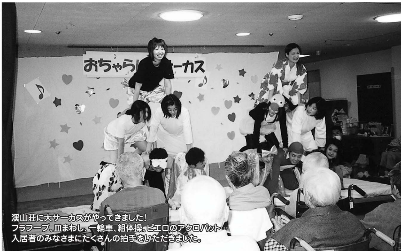
溪山荘に大サーカスがやってきました！ フラフープ、皿まわし、一輪車、組体操、ピエロのアクロバット… 入居者のみなさまにたくさんの拍手をいただきました。