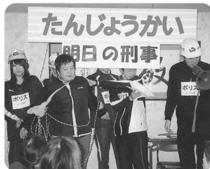
2月20日 敦賀警察署の新人警察官6名 の方が職場体験のため来荘され、凶悪犯の逮捕 劇を上演、迫力ある演技にみなさん“びっくり”