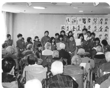
3月14日 咸新小学校児童のみな さんの友愛訪問です。ありがとう ございました。