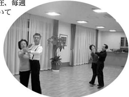
「ひまわりダンスクラブ」様のレッスンのご様子

前号にて紹介文を掲載のところ、社交ダンス「ひまわりダンスクラブ」様より申込みがありました。現在、毎週水曜日レッスンにご利用いただいております。