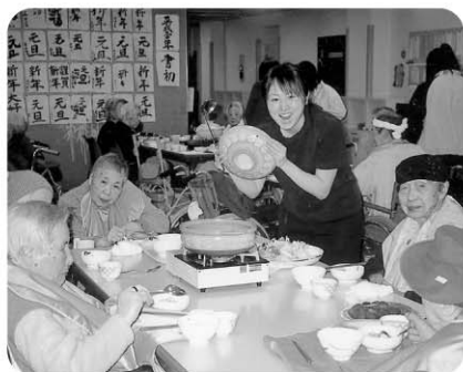
2月27日 「敬仁鍋」の日です。 温かくて美味しいですよ!!!