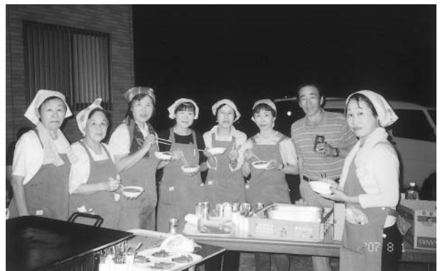
ボランティアとしてお手伝いをいただいた皆様方、 ありがとうございました。