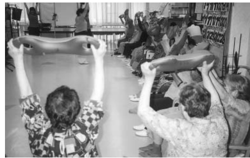
7月13日、ボランティアの3日体験の先生がお訪ね下さいました。利用者のみなさん、生懸命です。ありがとうございます。