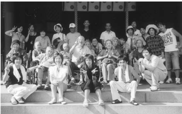
9月4日、敦賀まつりに気比神宮へ参拝しました。 本殿の前にて記念写真です。…ハイ!!!パチリ…