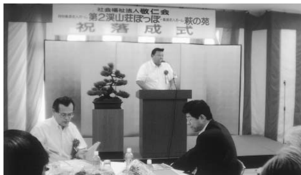
ご祝辞をいただきました、敦賀市長 河瀬 一治 様