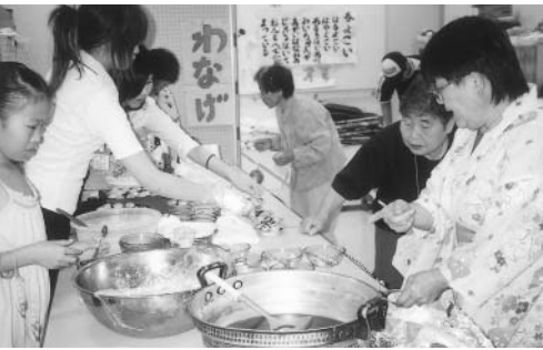
「夏まつり」たこ焼き・せんざい・プリン!!! みんな、おいしいですよ!!!