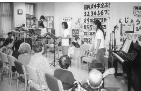
7月17日 ボランティアグループ「メロディドロップ」3名の方がお訪ね下さり、歌に演奏に楽しいひとときを過ごしました。ありがとうございます。