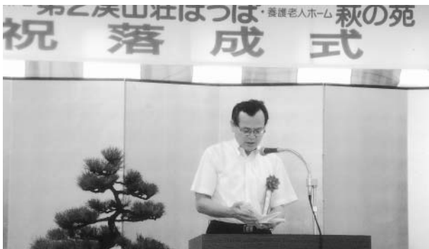
ご祝辞をいただきました、福井県副知事 旭 信昭 様