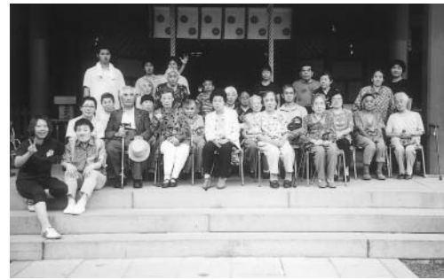
9月5・6日、敦賀まつりに気比神宮へ参拝しました。本殿前にて記念写真です。ハイ!!!ピース!!!