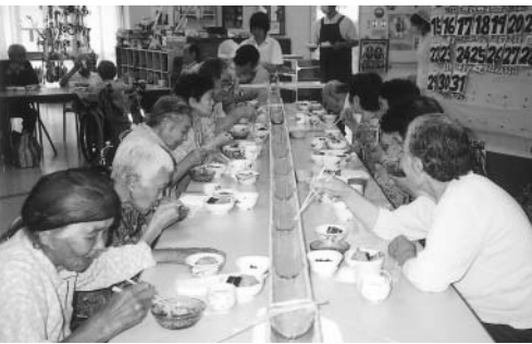
7月5日・6日 流しソーメンを実施しました!!! じゅるじゅる!!! おいしくちゅーヨ!!!