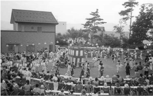
8月1日、恒例の盆踊り大会を開催、 華やかな踊りの輪が広がる広場