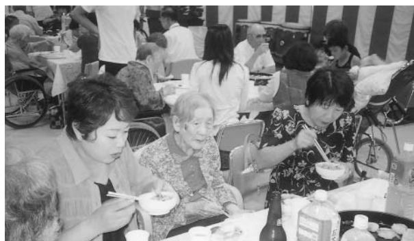
出来上がったそばに舌つづみ、おいしいですよ!!!