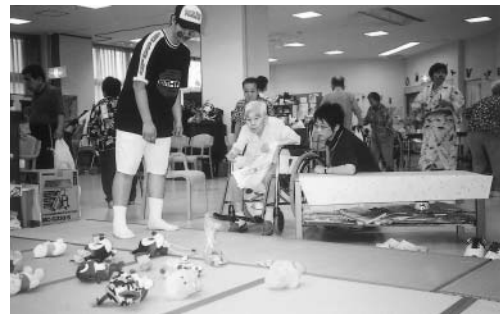
8月23日・24日、夏まつりを開催いたしました。輪なげです。入ったぬいぐるみはお持ち帰りできますヨ。