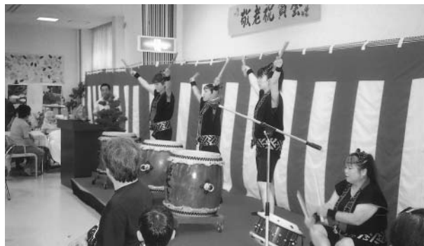
「姫太鼓」のみなさんの、勇ましい演舞・・・