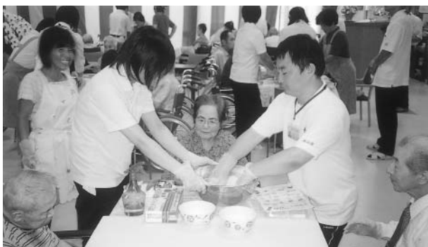
そば打ちに挑戦、おいしいそばが出来上がりますヨ!!!