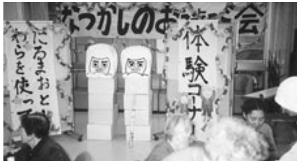
ダルマ落とし・通うりゃんせ・たんす長持ちなどの子がほしい・剣玉・かき餅干しなど、昔なつかしい“お遊び”で楽しい日を過ごしました。