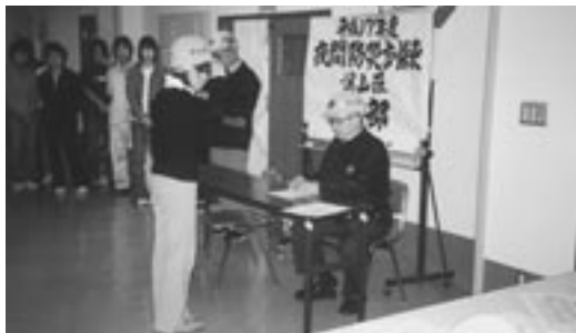
11月9日「夜間防災訓練」を実施、職員緊急連絡網より 全職員が集合、災害に備えました。