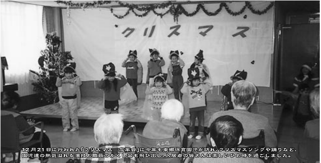
12月21日に行われた「クリスマス 忘年会」に今年も東郷保育園児が訪れ、クリスマスソングや踊りなど、園児達の熱気溢れる演技と職員のかくし芸も飛び出し、入居者の皆さんは楽しいひと時を過ごしました。