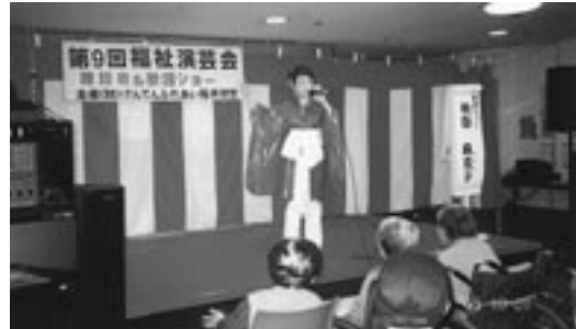
10月18日「げんでんふれあい福井財団」主催の“福祉演芸会”が 開催され、腹話術と歌謡ショーの楽しいひと時を過ごしました。