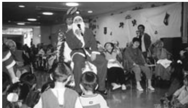
職員サンタクロースの登場、園児達の瞳が“キラキラ”