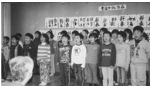
12月27日「松原児童館」の皆さん方の友愛訪問をいただき、歌に踊り に楽しい交流のひと時を過ごしました。ありがとうございました。