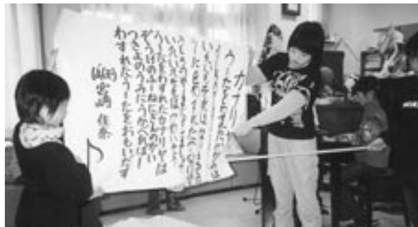
「かえるの子会」の皆さんの友愛訪問をいただき、ピアノ演奏・歌の合唱など楽しい日を過ごしました。ありがとうございました。