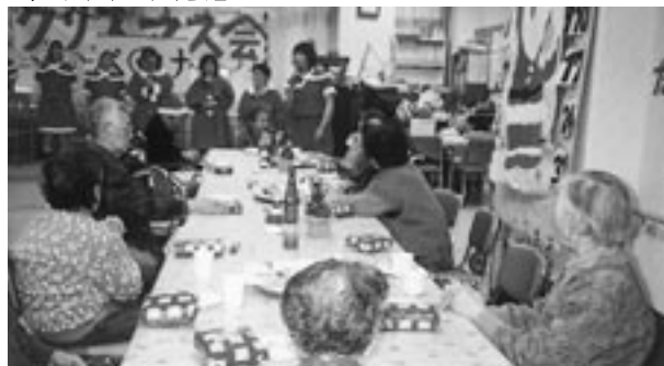
職員サンタによる、踊り・迷演技、素敵なプレゼントの交換など楽しい日を過ごしました。