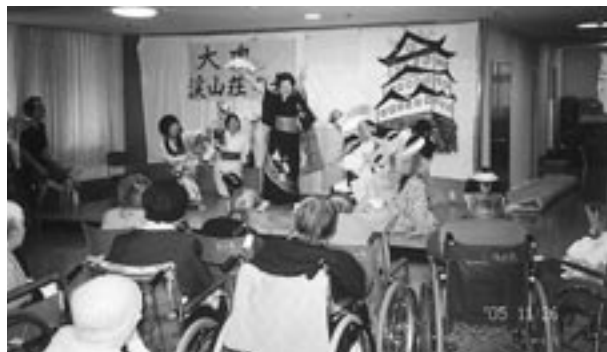
お局様の気迫溢れる迷演技に圧倒され、入居者の方々も一時“うっとり”