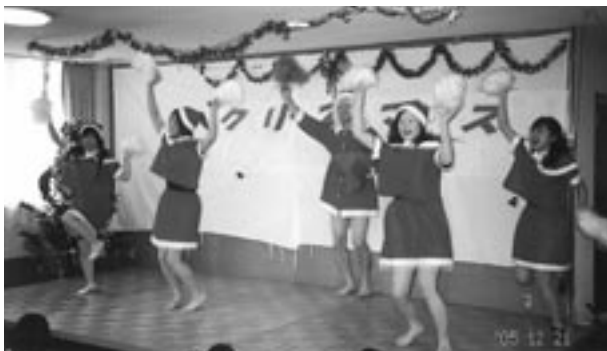
女性職員“サンタ”の激しいひと舞