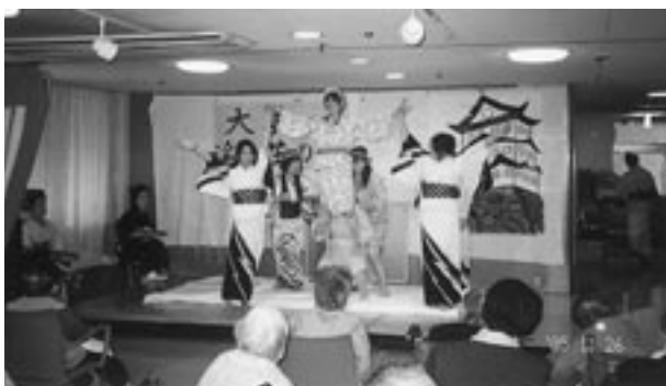
腰元達の華やかな踊り、日頃の練習の成果をご覧あれ