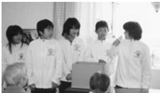
12月4日「咸新小学校子供会」のみなさんの来訪をいただき、 “お餅”をたくさんいただきました。ありがとうございました。