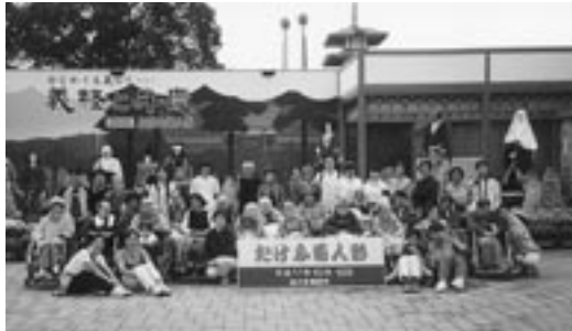
10月12日「たけふ菊人形」の見学に出かけました。 “義経と弁慶”の前で ハイ ぱちり