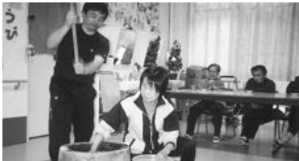
“べったんこ”“あっちっち” あったかいお餅は美味しいですよ