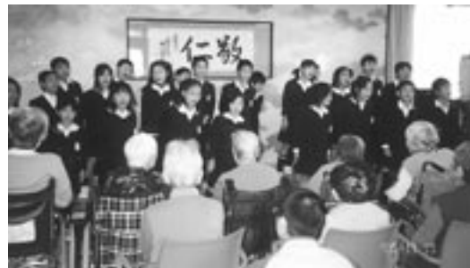
11月15日「杓見小学校」の皆さんの友愛訪問をいただき、折り紙・似顔絵 など、楽しい交流のひと時を過ごしました。ありがとうございました。