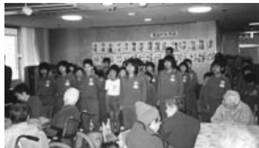
12月7日「東浦小学校」の皆さんの友愛訪問をいただき、ベット・車イスの清掃、 折り紙・似顔絵など、楽しい交流のひと時を過ごしました。ありがとうございました。