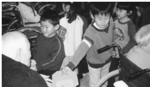
園児の皆さんより素敵なプレゼントをいただきました。思わず涙がほろり