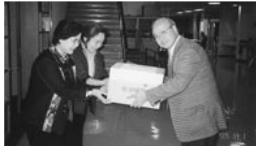
11月1日「本町1丁目婦人部」の方の来訪をいただき、 記念品を頂戴いたしました。ありがとうございました。