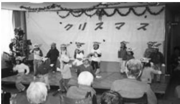
友情出演、東郷保育園児達のかわいい“ダンス”

12月21日東郷保育園児の来訪をいただき、楽しい「クリスマス会」を開催いたしました。ちびっこ達との交流に、入居者の皆さんも思わず“にっこり”心温まる一日を過ごしました。