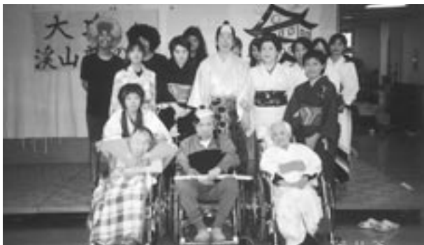
将軍様を囲み、出演者一同勢ぞろい

11月26日迷演芸会が開催されました。職員の気迫溢れる迷演技に入居者の皆さん方も一時うっとり、そのあとの大笑い、楽しいひと時を過ごしました。