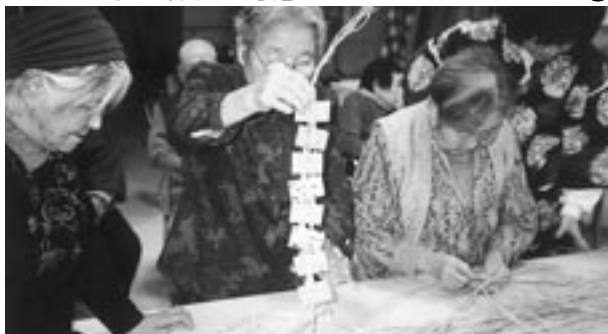
わら縄で“かき餅干し”じょうずに出来あがりましたヨ