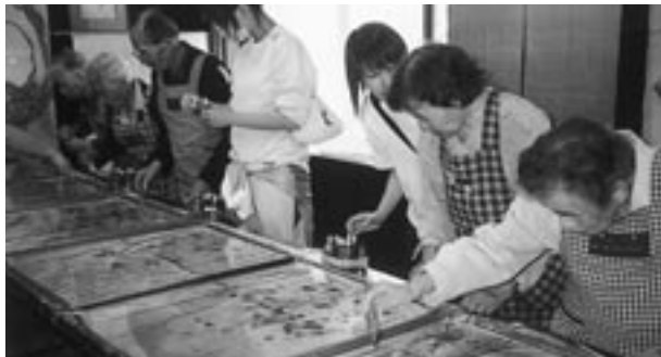
滋賀県高島市に出かけ“墨流し染めを体験”カラフルなハンカチが出来上がりました。