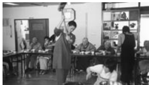
12月28日 恒例の「餅つき大会」を開催、“ハイ ベッタソコ” 美味しいお餅がつき上がりましたヨ。