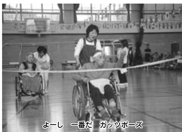
よし 一番だ ガッツポーズ