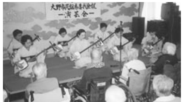
5月25日 大野市民謡秀喜代会ご一行が友愛訪問され、歌に踊りに演奏に、華やかな舞台を繰り広げられました。