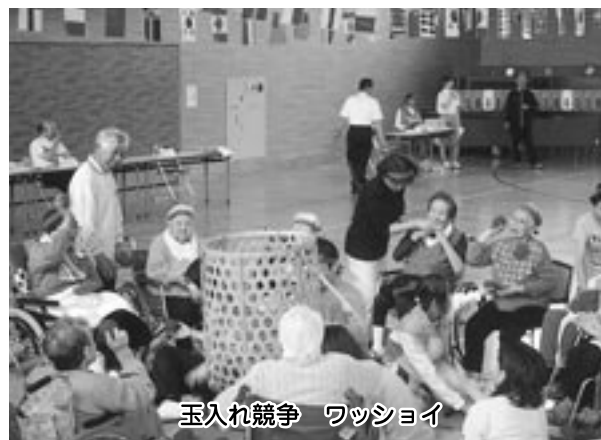
玉入れ競争 ワッショイ