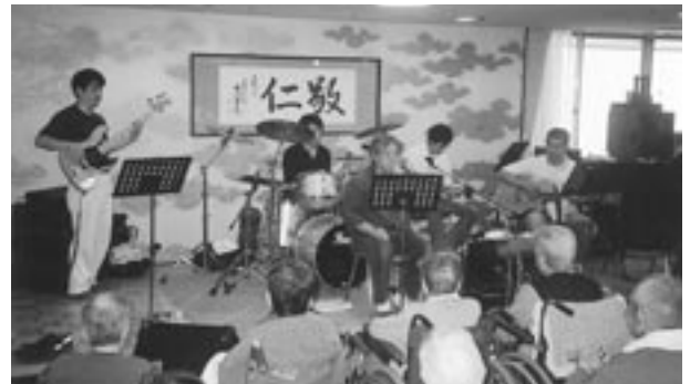
5月7日 港町44丁目バンドが来訪され、ギターとドラムとベースによる楽しい音楽のプレゼントを受けました。