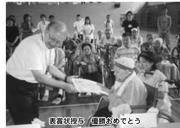
表彰状授与 優勝おめでとう