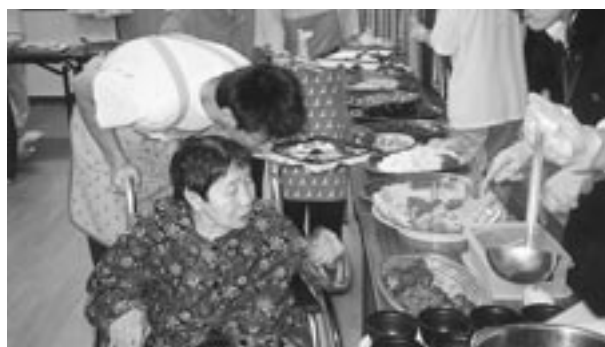
5月18日 溪山荘では毎月1回、バイキングの日を開催いたしています。おいしいご馳走がより取り見取り、楽しい一日でした。