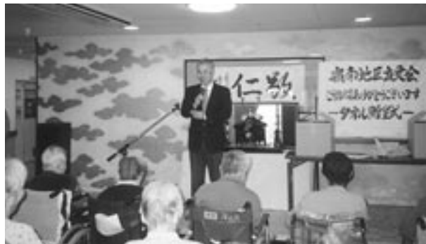
4月12日 嶺南地区友愛会の皆様方が、入居者の方々を表敬訪問されました。