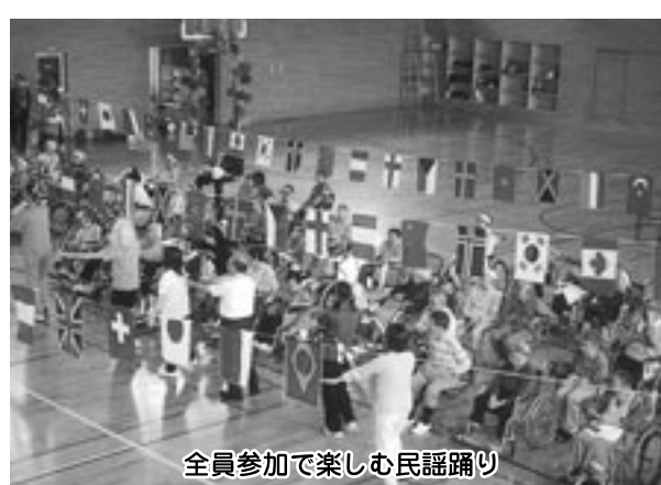
全員参加で楽しむ民謡踊り