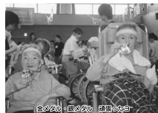
金メダル・銀メダル 頑張ったヨ