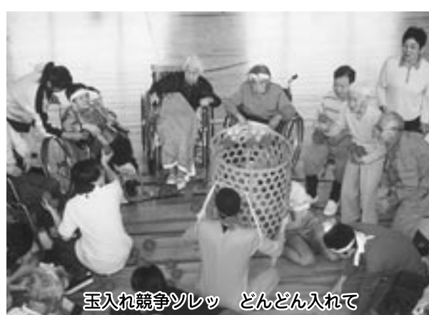
玉入れ競争ソレツ どんどん入れて