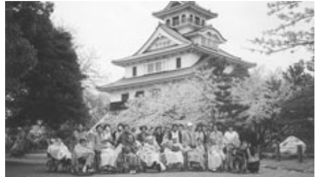
4月12日 恒例のお花見会、長浜市の豊公園を散策し満開の桜の下、長浜城をバックに記念写真、楽しい一日でした。