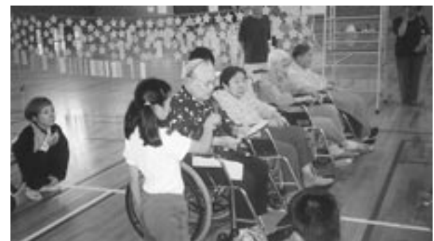
6月30日 咸新小学校の七夕のつどいに招かれ、児童とともにゲームや歌で楽しいひと時を過ごし、親交を深めました。