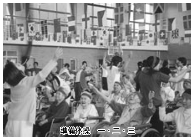
準備体操 一・二・三