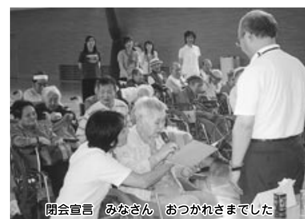
閉会宣言 みなさん おつかれさまでした