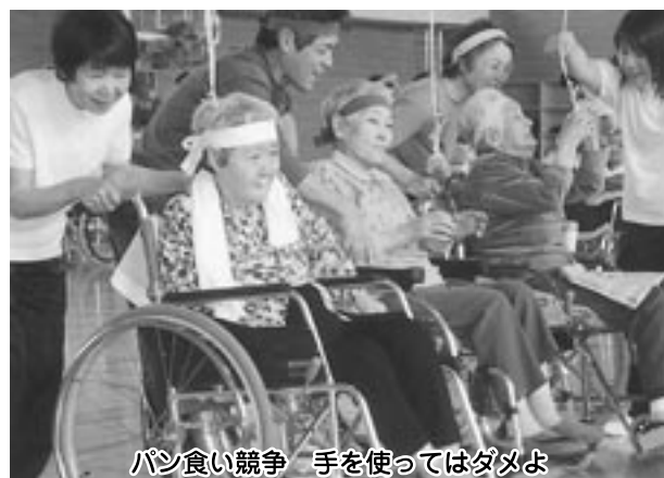
パン食い競争 手を使ってはダメよ