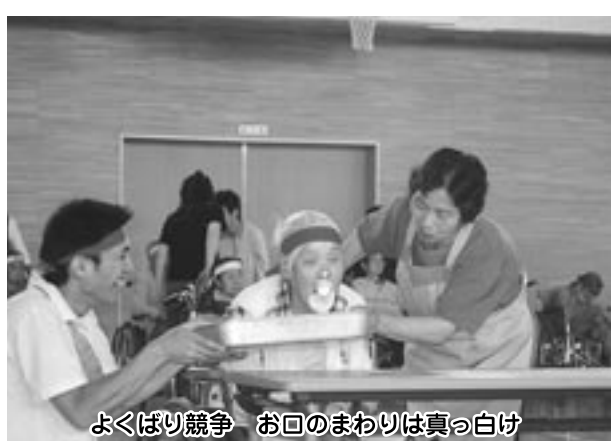
よくばり競争 お口のまわりは真っ白け