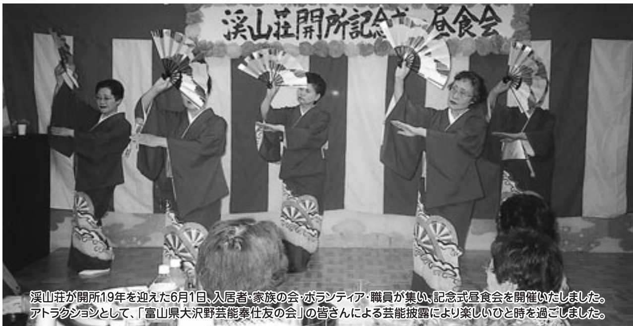
溪山荘が開所19年を迎えた6月1日、入居者・家族の会・ボランティア・職員が集い、記念式昼食会を開催いたしました。アトラクションとして、「富山県大沢野芸能奉仕友の会」の皆さんによる芸能披露により楽しいひと時を過ごしました。