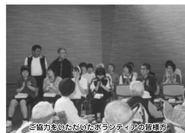
ご協力をいただいたボランティアの皆様方