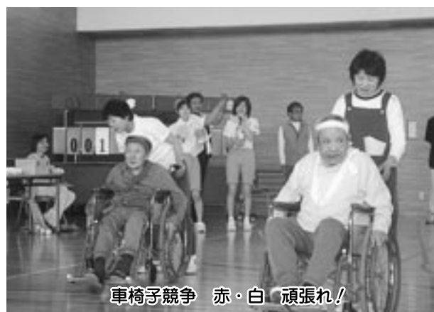
車椅子競争 赤・白 頑張れ!