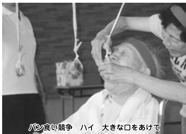
パン食い競争 ハイ 大きな口をあけて