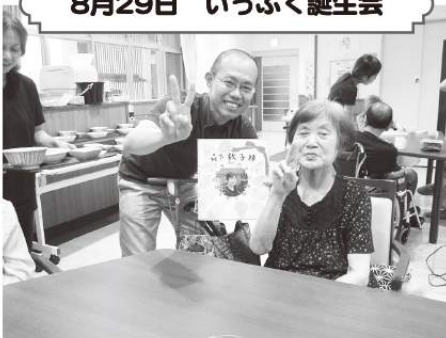
8月29日 いっぷく誕生会