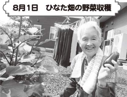
8月1日 ひなた畑の野菜収穫