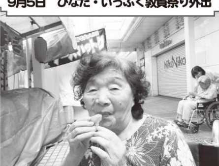
9月5日 ひなた・いっぷく敦賀祭り外出