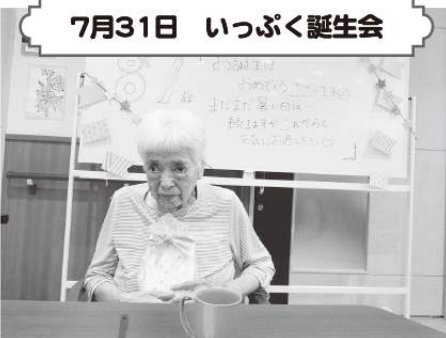
7月31日 いっぷく誕生会