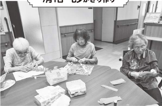
7月1日 七夕かざり作り