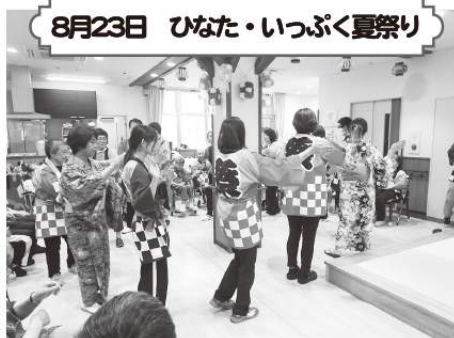
8月23日 ひなた・いっぷく夏祭り