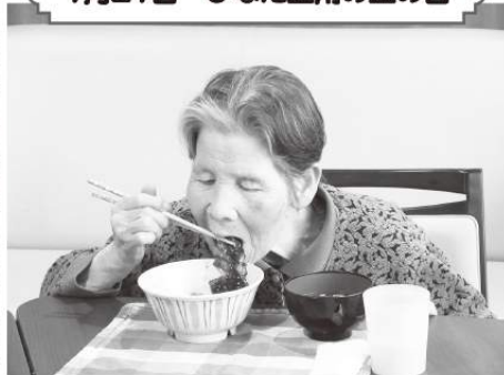
7月27日 ひなた土用の丑の日