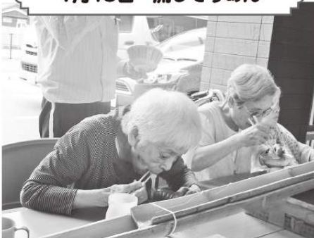
7月19日 流しそうめん