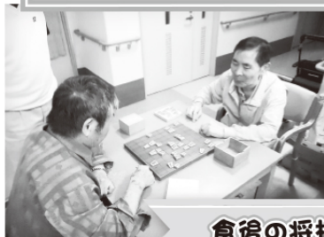
食後の将棋・麻雀