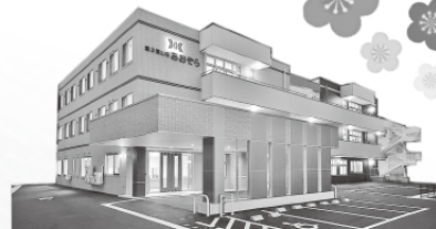
地域密着型特別養護老人ホーム第3溪山荘 あおぞら