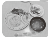
メリークリスマス♪