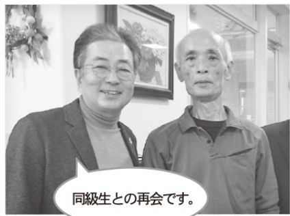
同級生との再会です。