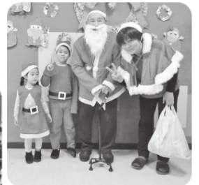
ちびサンタにもお手伝い頂きました