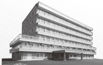
特別養護老人ホーム第2溪山荘 ぽっぽ