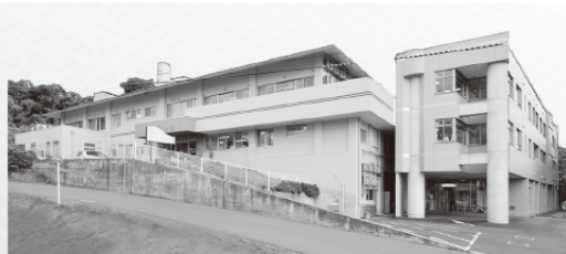
特別養護老人ホーム 溪山荘