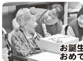
お誕生日おめでとうございます！