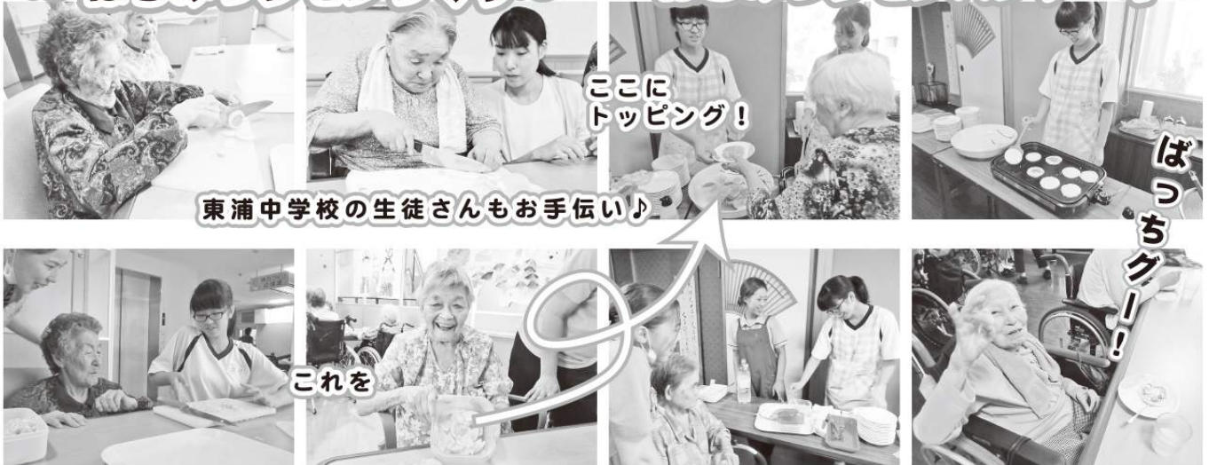
東浦中学校の生徒さんもお手伝い♪