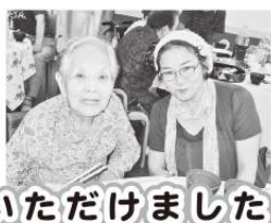
ご家族の皆さんにも楽しんでいただきました