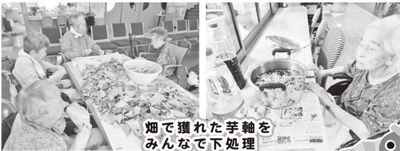
畑で獲れた芋軸をみんなで下処理