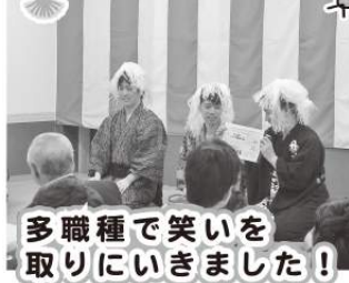
多職種で笑いを取りにいきました!