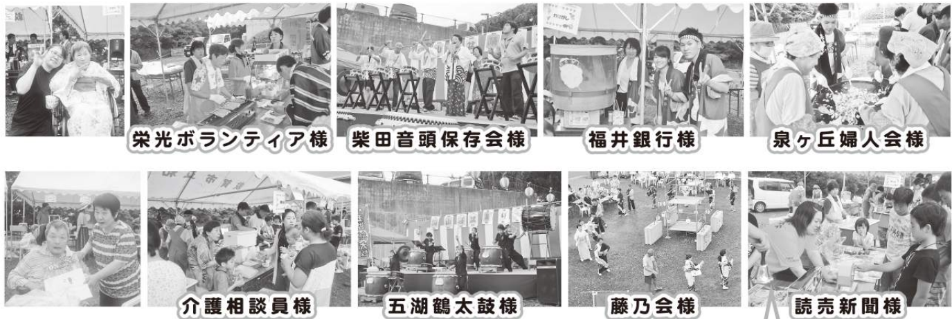
栄光ボランティア様