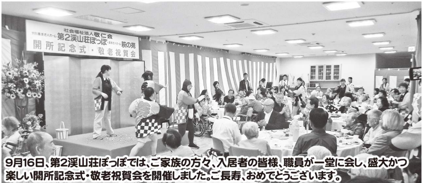
9月16日、第2溪山荘ぼっぼでは、ご家族の方々、入居者の皆様、職員が一堂に会し、盛大かつ楽しい開所記念式・敬老祝賀会を開催しました。ご長寿、おめでとうございます。