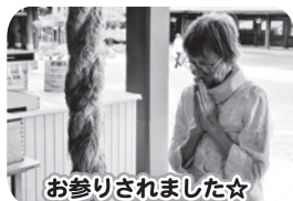
お参りされました☆