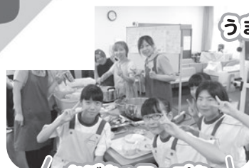
かぼちゃスープを 作ってくれました!