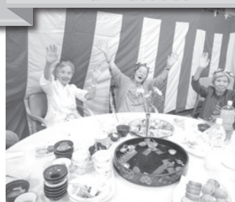
ご長寿の皆様が主役！ おめでとうございます