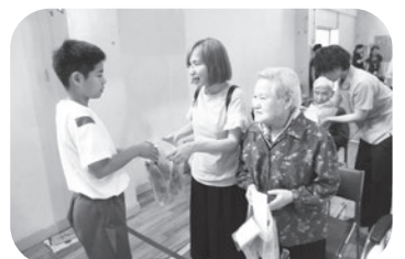
子供達と楽しくすごしました。