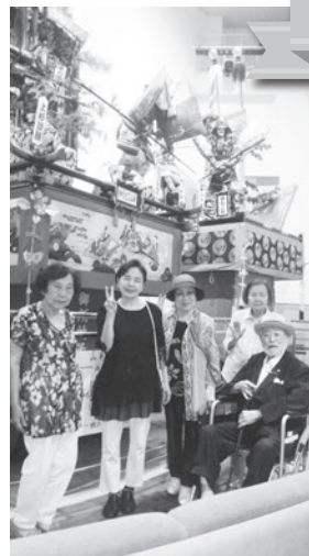
敦賀の歴史に ふれ改めて 地元敦賀の よさを知る♪