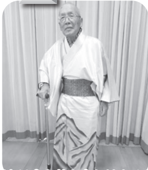
輝きは今も昔も変わりません☆