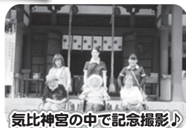
気比神社の中で記念撮影♪