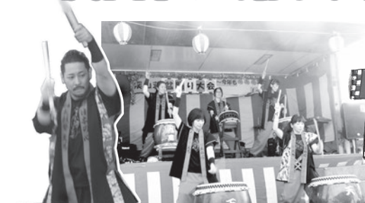
和太鼓天馬様 天までとどろく 迫力のある演奏でした♪

Jelly Bean,s ポップでかわいい子供たち 暑い中元気に踊ってくれました♡