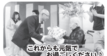
これからも元気で お過ごしください!