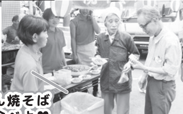
お父さん焼そば 一緒に食べよ♡