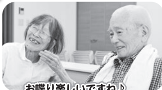
お喋り楽しいですね♪