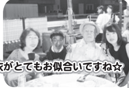
浴衣がとてもお似合いですね☆