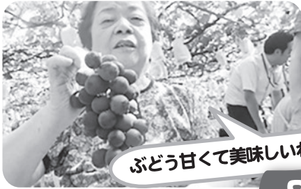
ぶどう甘くて美味しいわ~!!