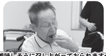
美味しそうに召し上がっておられます☆