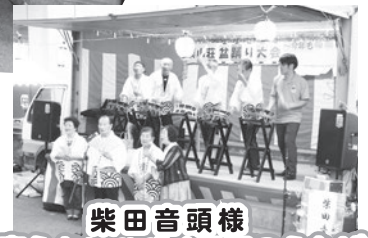
柴田音頭様 声高らかにひびく民謡のうたげ