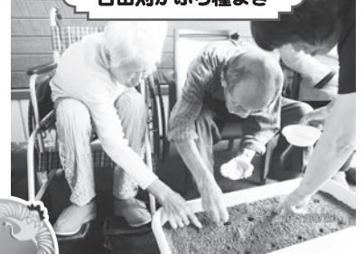
古田刈かぶら種まき