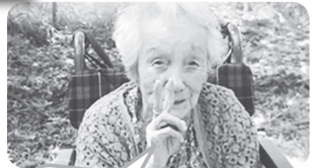
皆で食べた弁当 美味しかったわ!!