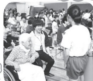
今年はどうなおねがいを しようかな?♪