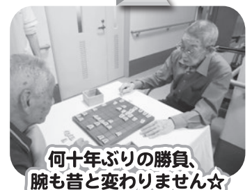
何十年ぶりの勝負、腕も昔と変わりません☆