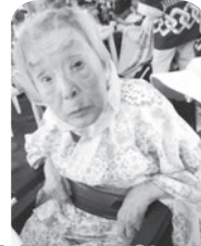
皆と食べると美味しいね!! 沢山の方が来られ、とても賑わいました!!