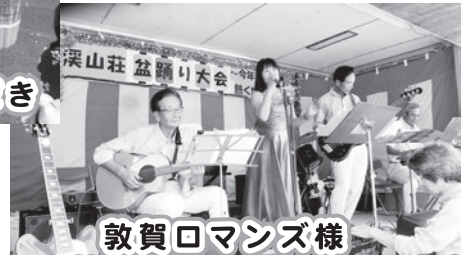
敦賀ロマンス様 しっとりときかせる歌声がすてき☆