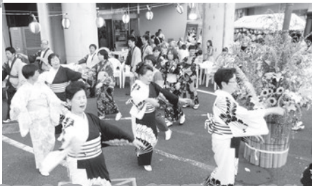
藤乃会様よりご指導いただき 職員みんな踊れる ようになりました!