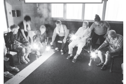
ひなた・いっぷく花火大会