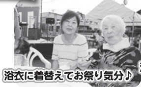
浴衣に着替えてお祭り気分♪