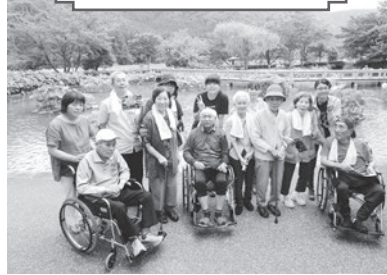
花はす公園お出かけ