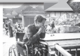
長命水を飲んでご利益を いただきました