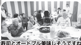
お寿司とオードブル美味しそうですね☆