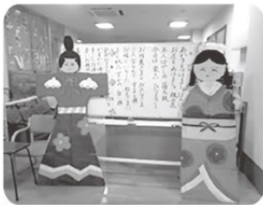
うれしいひなまつりにを 合唱した後は、お待ちかねの ビンゴゲーム大会！ 素敵なプレゼントが当たり ましたよ☆