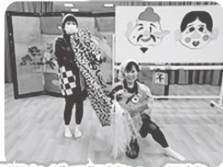
福笑いや獅子舞、二人羽織などで初笑い、爆笑