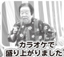
カラオケで盛り上がりました～