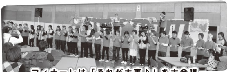
フィナーレは「それが大事♪」を大合唱