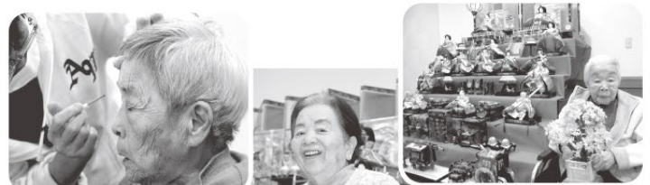
きれいになって写真撮影