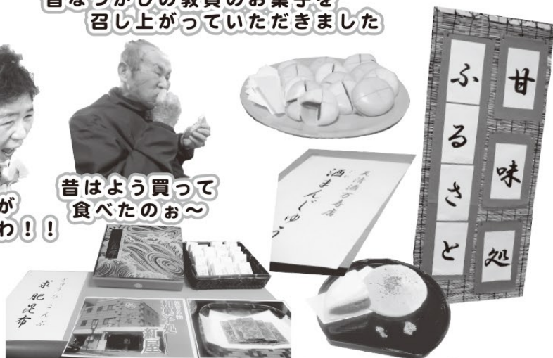
昔はよう買って 食べたのお～