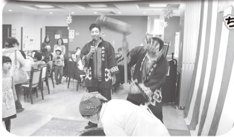
ちびっこ餅つき体験！

地域交流イベントとして新春餅つき大会を開催しました。たくさんの方にご来場いただきました。