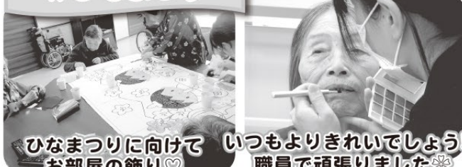
ひなまつりに向けていつもよりきれいでしょ!!! お部屋の飾り♡ 職員で頑張りました*