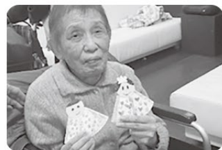
デイサービス風景：雛人形作り