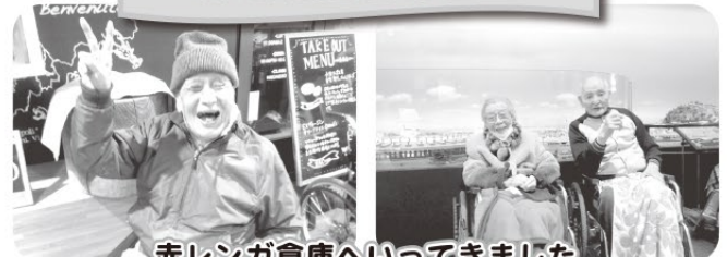
赤レンガ倉庫へいってきました