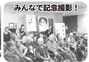
みんなで記念撮影！