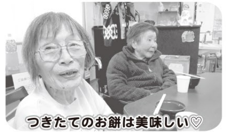
つきたてのお餅は美味しい♡