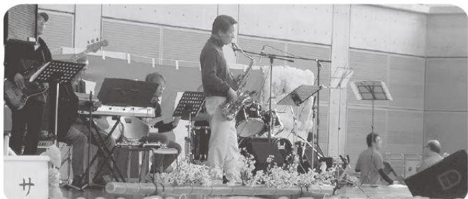
サムシングクール様によるバンド演奏