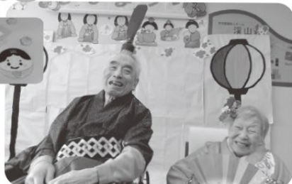
お内裏様 笑顔が素敵☆