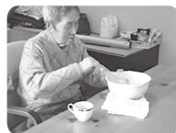
匠：パンケーキ作り