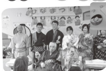
完成！！溪山荘人間ひな段 皆さんでお祝いしました。