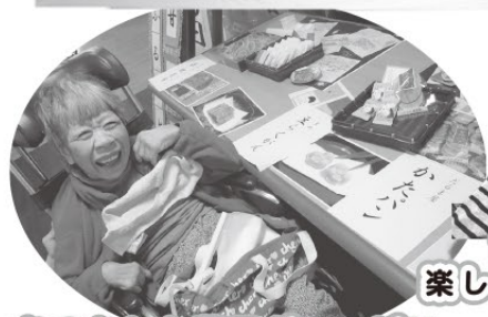
なつかしお菓子がいっぱい どれにしようかな～