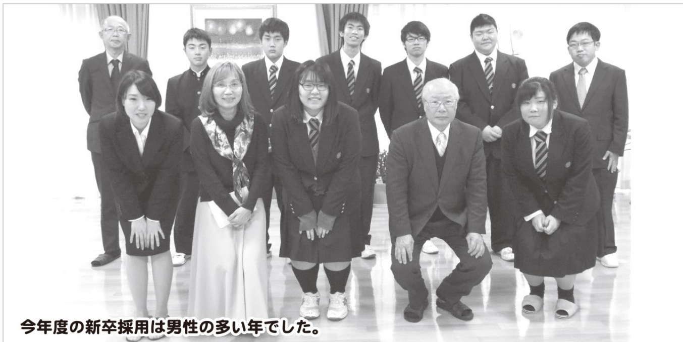
今年度の新卒採用は男性の多い年でした。