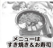
メニューはすき焼き&お寿司！！