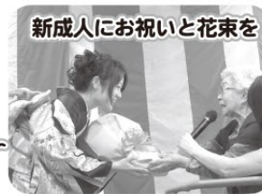
新成人にお祝いと花束を