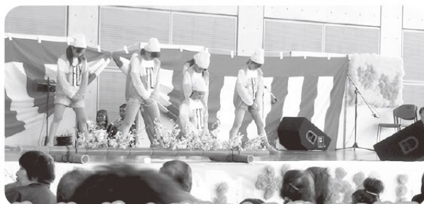
ジェリービーンズ様によるダンスの披露