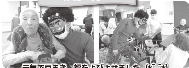
元気で豆まき、福をよびよせました (*_*)