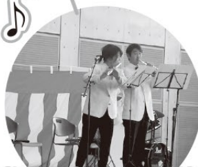
素敵な音色フルート演奏♪