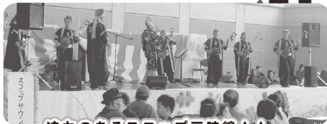
迫力のあるスコップ三味線！！