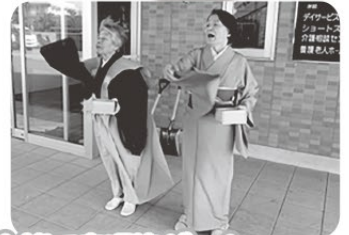
年女さんによる豆まきと皆で鬼退治ゲーム