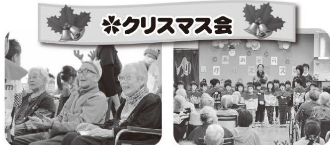
子供たちのハンドベル感動しました。