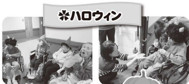
皆でわいわい仮装しました。