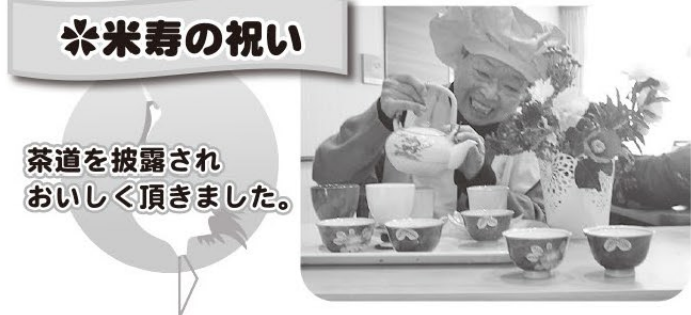
茶道を披露されおいしく頂きました。