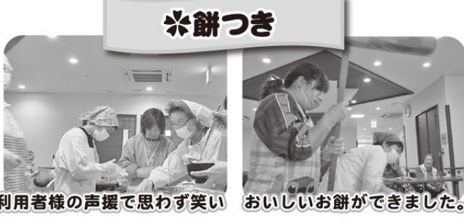
利用者様の声援で思わず笑い おいしいお餅ができました。