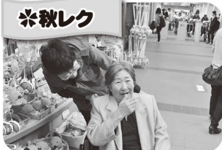
アクアとときふに行ってきました。たくさんの魚を見て楽しい時間でした。