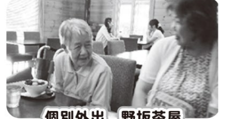
個別外出 野坂茶屋