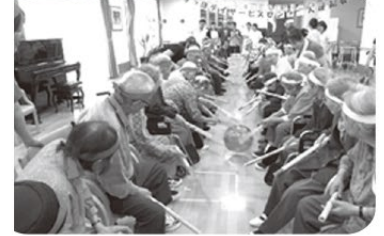
赤白対抗! 頑張れホッケー!