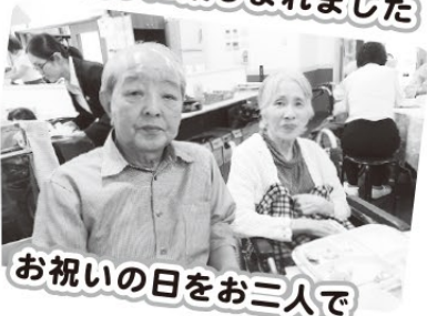
お祝いの日をお二人で