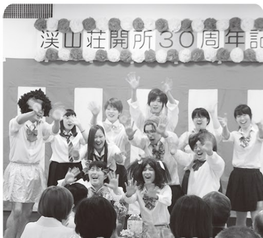
フライングゲット 溪山荘AKB