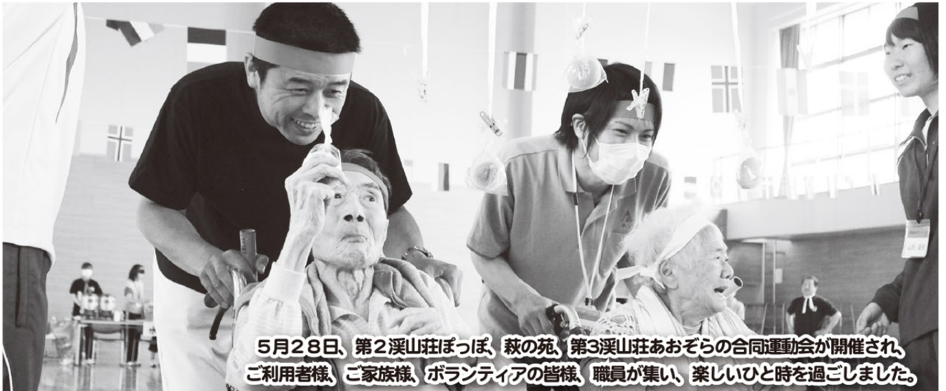
5月28日、第2溪山荘ぼっぼ、萩の苑、第3溪山荘あおぞらの合同運動会が開催され、ご利用者様、ご家族様、ボランティアの皆様、職員が集い、楽しいひと時を過ごしました。