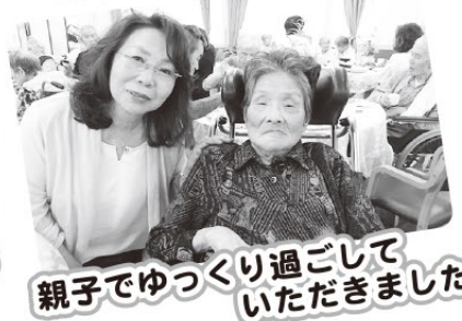
親子でゆっくり過ごして いただきました