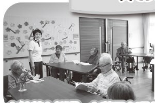
お抹茶と桜湯、お菓子を頂き春の歌を