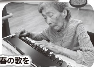
大正琴に合わせて歌いました。