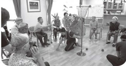
団体競技、玉入れ合戦