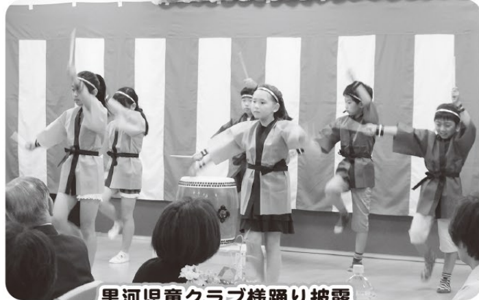
黒河児童クラブ様踊り披露