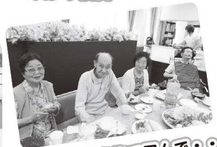
お料理を家族で囲んで。。。