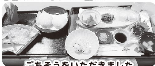
ごちそうをいただきました