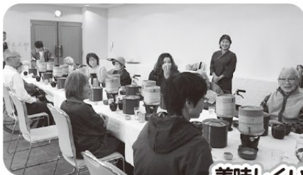
美味しくいただきました