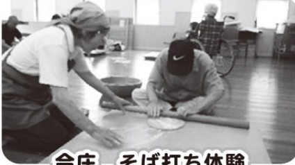
今庄 そば打ち体験