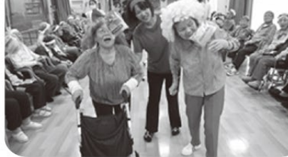
童心に帰ってパン食い競争!