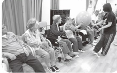
大玉送り、お隣りへ、それっ!