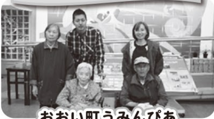
おおい町うみんぴあ