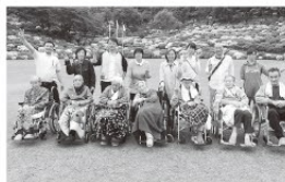
◆西山公園つつじ祭