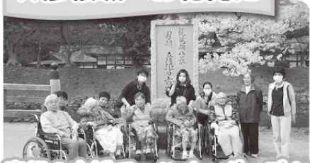
彦根の古城で ハイポーズ!!!