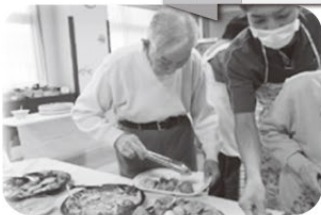
大好評 ランチバイキング

参加者の中には「最近着物を着ることがなくなったわね」という昔を懐かしむお話もされていました。