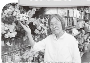
本人・ご家族様の希望を聞いて、色々な誕生日会を企画しています。