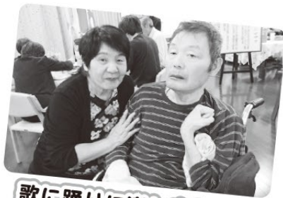
歌に踊りに楽しめました