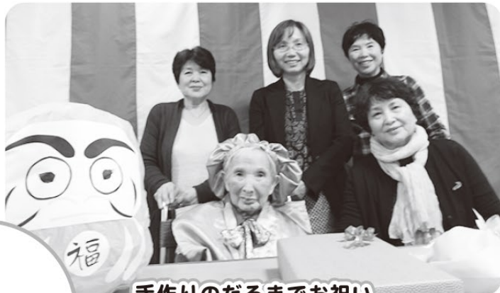
手作りのだるまでお祝い