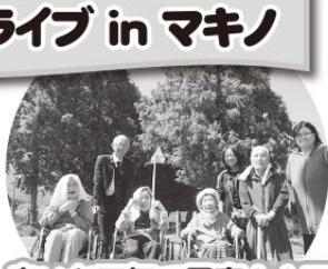
良いお天気で最高!!アイスも美味しかったよ