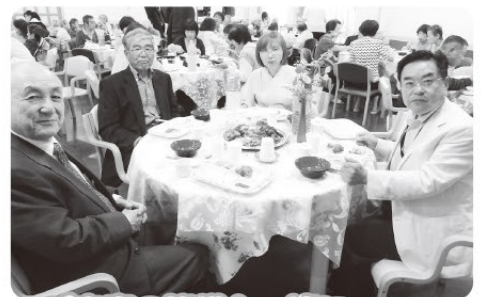
ご来賓の皆様と一緒に。。。