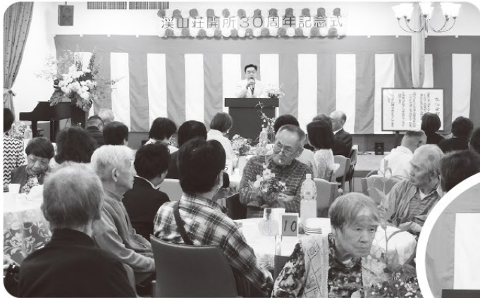
溪山荘開所30周年記念式