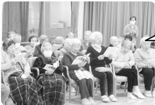
2月9日 ふるさとの日 ピアノ演奏と 歌おう会に皆で 参加しました!!