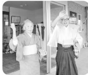
豆まきは96歳の 年男・年女さんが行いました