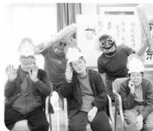
手作りの福の神のお面をつけて鬼退治ゲーム