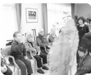
チラシを投げて枯れ木に花を咲かせましょうゲーム