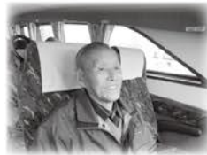
ちょっと緊張します