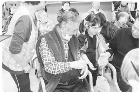
3月5日 木崎保育園児が来苑し太鼓を披露。 その後園児とふれ あいました。 とってもかわいかったです!!!