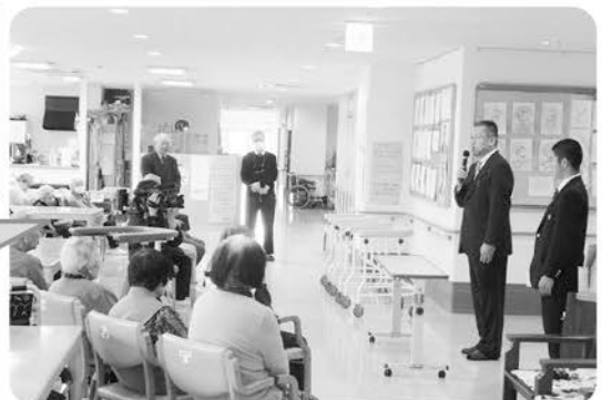
3月20日 気比高校より歩行 器3台の寄贈が ありました。 大事に使わせて いただきます!!