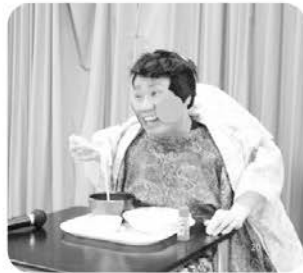
大爆笑の二人羽織