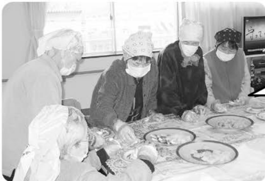
1月20日 おやつ作り ホットケーキ作って 美味しくいただきました!!