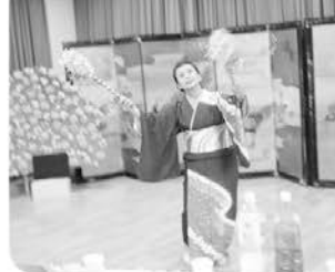
歌あり、踊りあり、プレゼントありと皆でお祝いしました