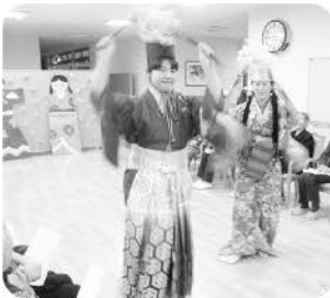
みんなで歌ったり、踊ったり