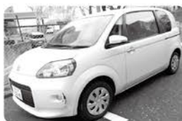
開業時から活躍中のボルテ