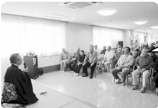
3月18日 春の彼岸法要 永覚寺ご住職様の 法話をありがたく お聞きました!!