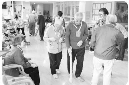
2月3日 節分 お面をつけてゲーム を楽しみました!!