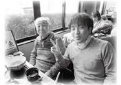
来年も初詣行こうね!