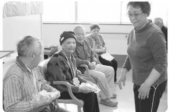
2月25日 1月・2月合同誕生会 職員からプレゼント 皆さん嬉しそうでした!!