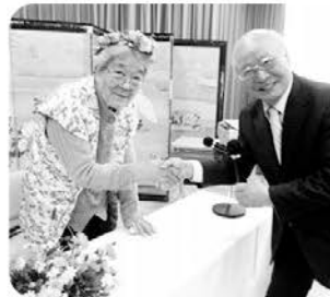
衣装やケーキは職員が手作りました