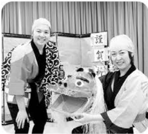
無病息災を祈って獅子舞