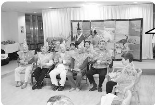
3月4日 ひな祭り 萩の苑ひな壇が 出来上がりました!!