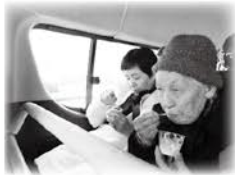
松月名物レモンラーメン美味しいわ!