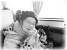
大海原へ行ってきます!