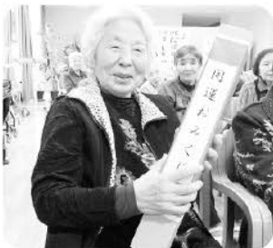
やった～おみくじは大吉!