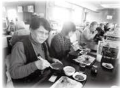
バイキング美味しいわ!