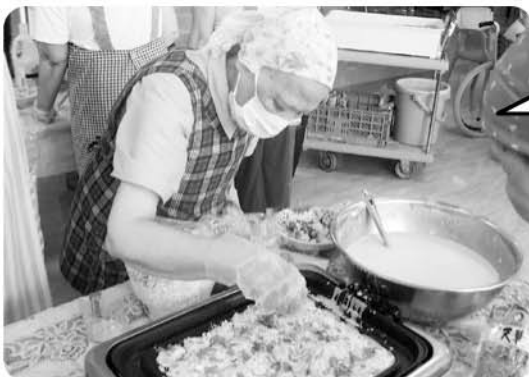
8月27日 おやつサークル お好み焼きとたこ焼きを作りおいしくいただきました!!