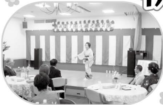
日本舞踊を披露していただきました。