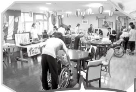
屋台の雰囲気 味わっていただきました!