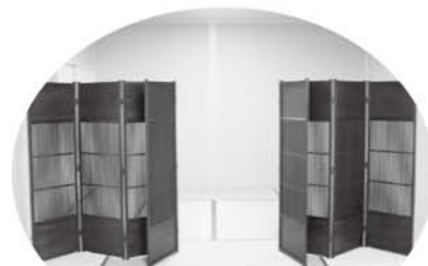
落ちついた雰囲気静養室