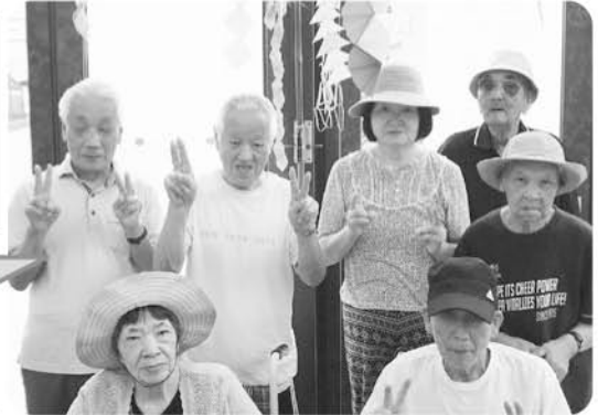
7月3日 オルパークへ七夕飾りを見に行きました!!