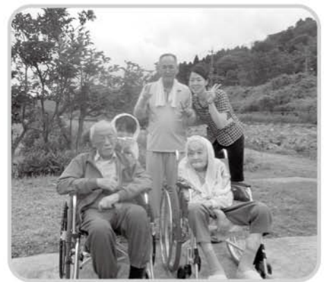
花ハスを見に行きました!