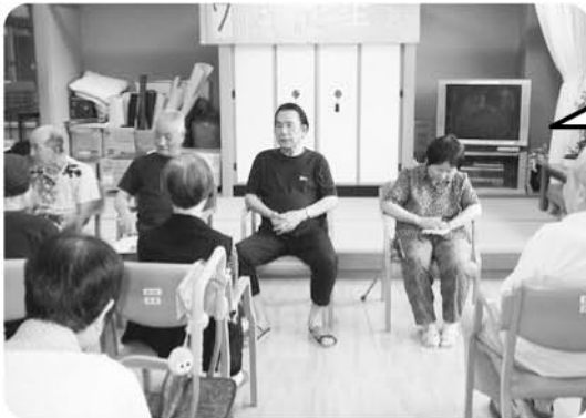
7月23日 7月の誕生会 皆さんでお祝いです!!