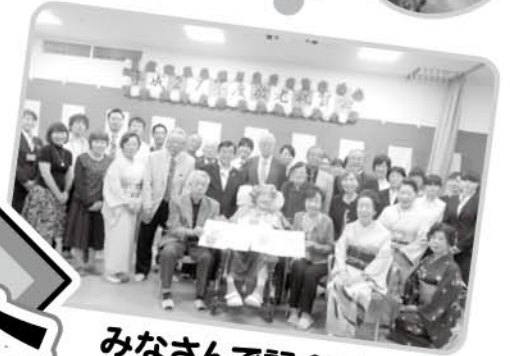
みなさんで記念写真