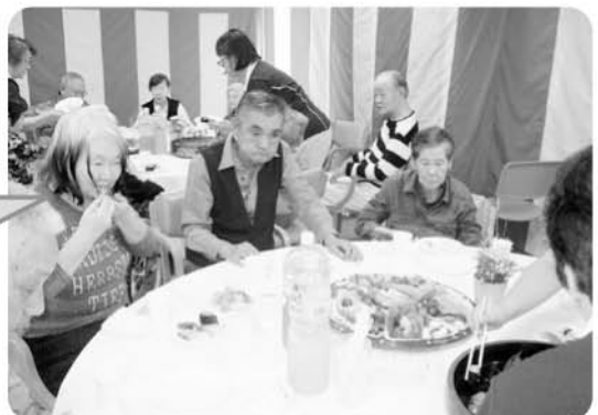
9月20日 開所記念式・敬老祝賀会 豪華なお寿司とオードブル ほっぺが落ちました!