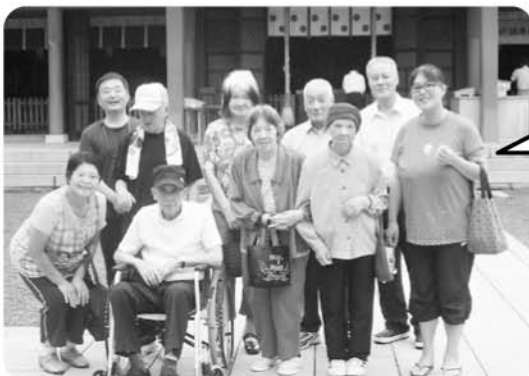
9月7日 敦賀まつり 氣比神宮に参拝し記念撮影!!