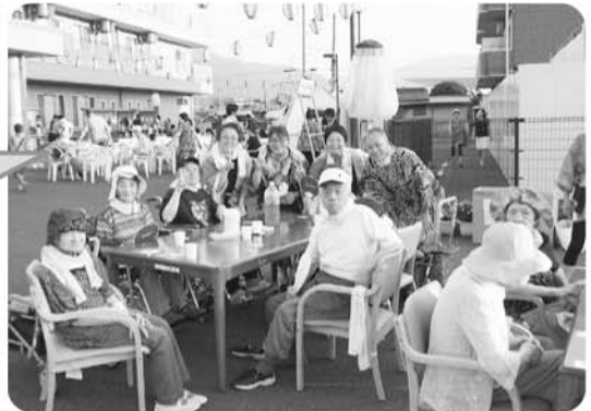
8月7日 夏祭り 暑い夏を吹き飛ばすよう存分に楽しみました!!