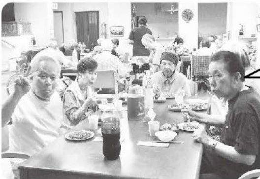
6月28日 恒例のBBQ お肉も焼きそばも美味しかったです!!