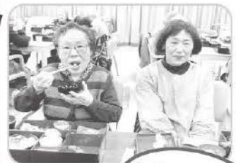
お花見宴会は ちらし寿司