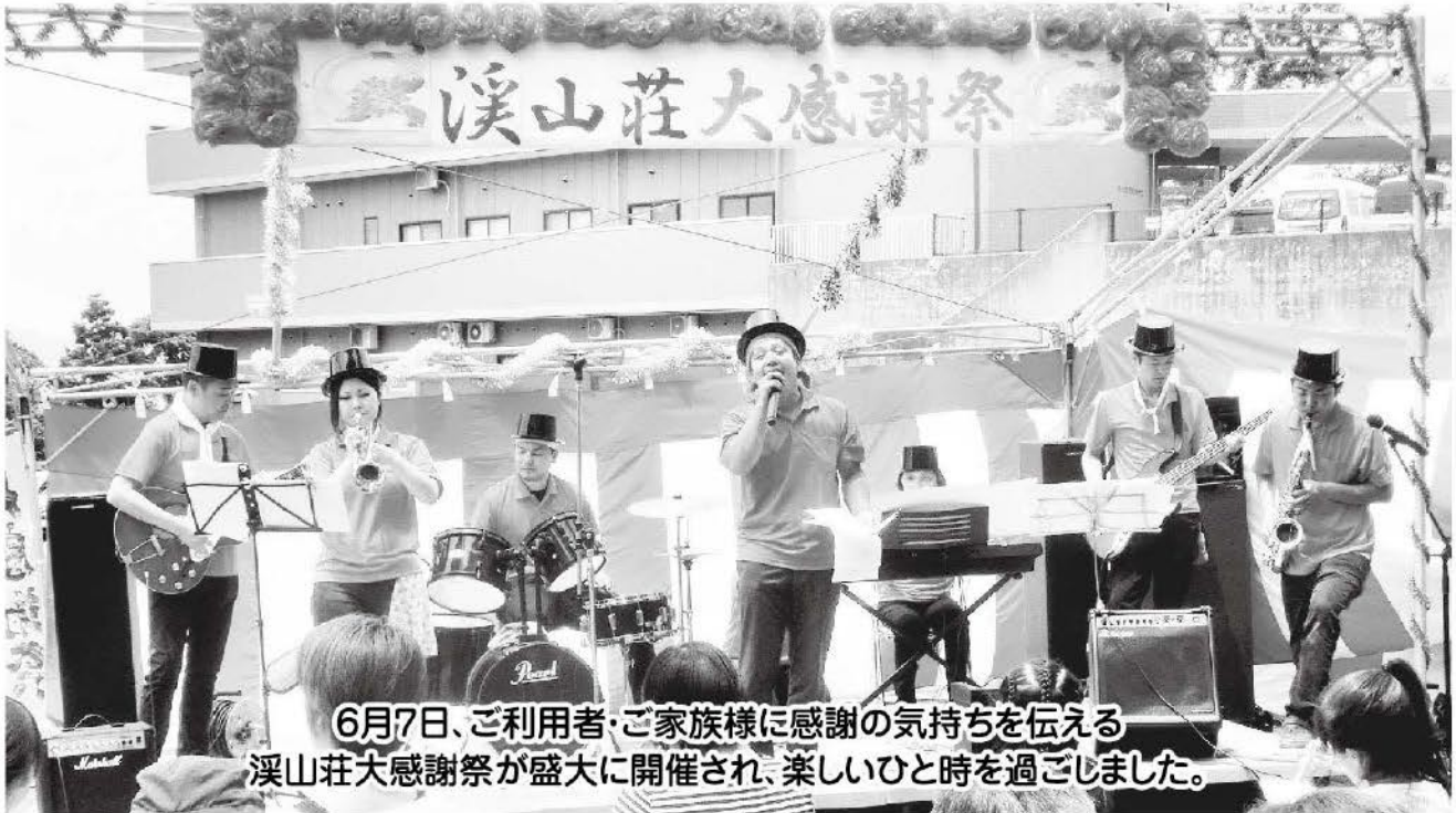
6月7日、ご利用者・ご家族様に感謝の気持ちを伝える 溪山荘大感謝祭が盛大に開催され、楽しいひと時を過ごしました。