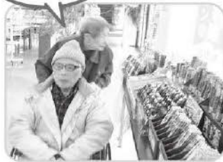
おみやげは 何にしよう