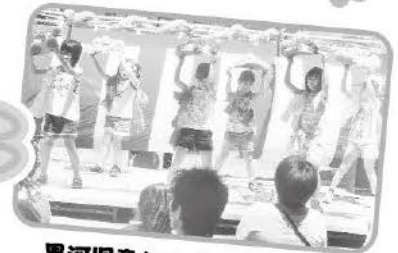
黒河児童クラブの皆さんによる 花笠音頭披露!