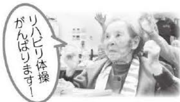
リハビリ体操 がんばりますー