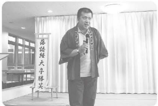
6月29日 今回で3年目の落語の会 手品もあって面白かったネ!!