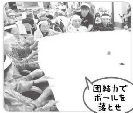
団結力で ポールを 落とせ