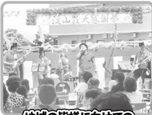
地域の皆様に向けての KEIJINバンド演奏!