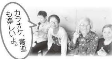
カラオケ、書道 も楽しいよ。