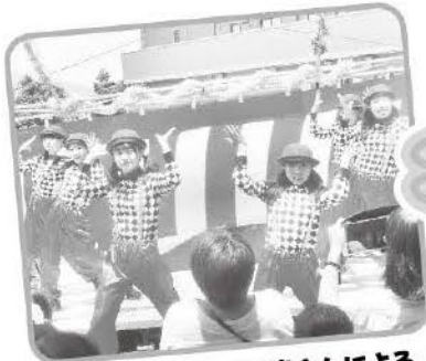
♪ ジェリービーンズの皆さんによる ダンスパフォーマンス!