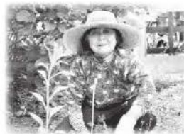
畑も頑張っています。