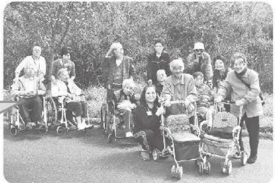
4月22日 お花見第2班、市総合運動公園にて、桜の広場で遅咲きです!!