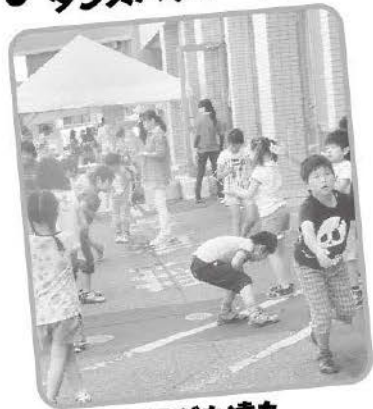
地域の子とも達も たくさん来てくれました!