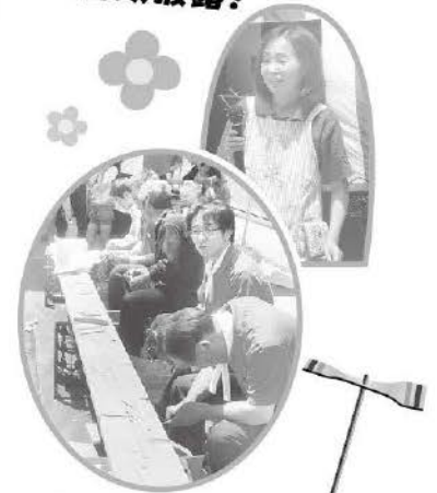
地域の方より伝授いただいた 竹とんぼ作り!