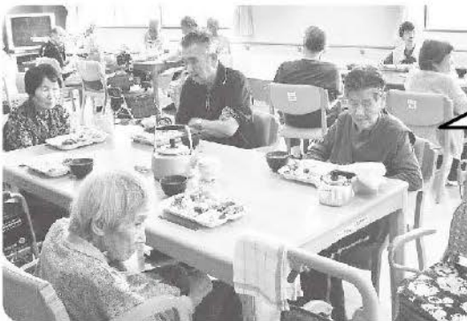
5月29日 お食事バイキング 美味しく食べて過ぎた方もいました!!