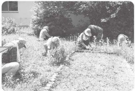
5月27日 あかり苑にて草刈りのお手伝いをしました。暑かった!!