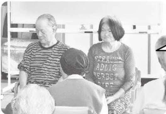
4月30日 4月誕生会です。ピンゴゲームもありました!!