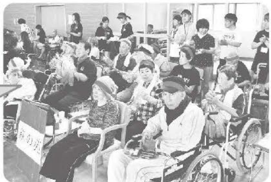
6月13日 大運動会 白組・赤組に分かれ、皆さん頑張って大健闘しました!!