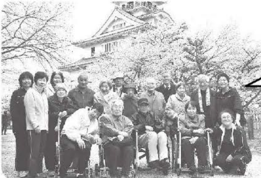
4月9日 お花見第1班、豊公園にて記念撮影、桜満開でした!!