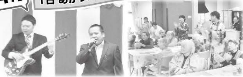
溪山荘グループの敬仁バンドが来てくれました