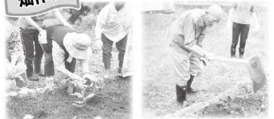
今年も12種類の野菜を作っています。収穫が楽しみです!