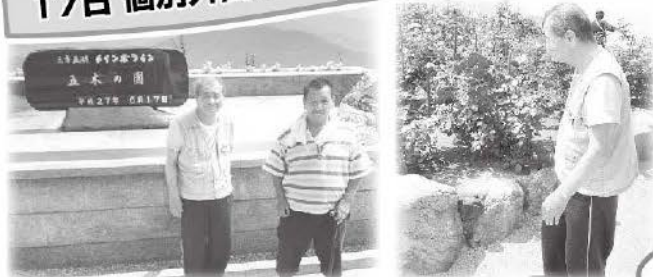
ご利用者のご希望に合わせて外出を行っています