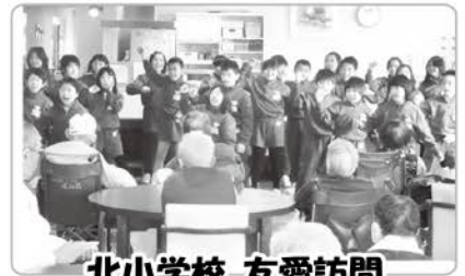
北小学校 友愛訪問