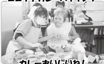
カレーおいしいね!