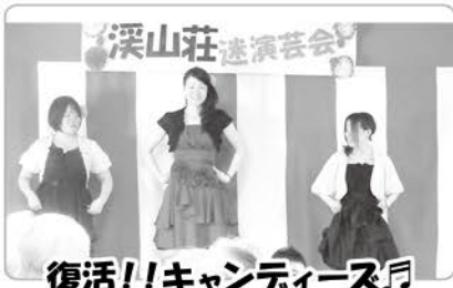
復活!!キャンディースク