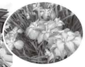
▲しょうぶ見に行きました