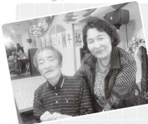
ご夫婦仲良くハイチーズ!