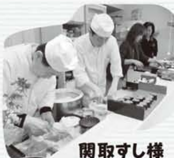
関取すし様 本日、溪山荘参上!