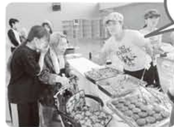
カレーバイキング 大運動会