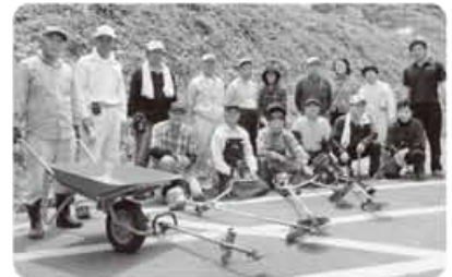
▲民生委員の皆様夏季清掃 ありがとうございました。