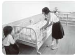
▲中郷小学校の皆様 友愛訪問