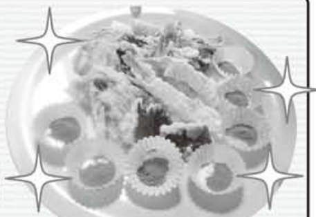
天ぷら完成!! 抹茶塩どうぞ...