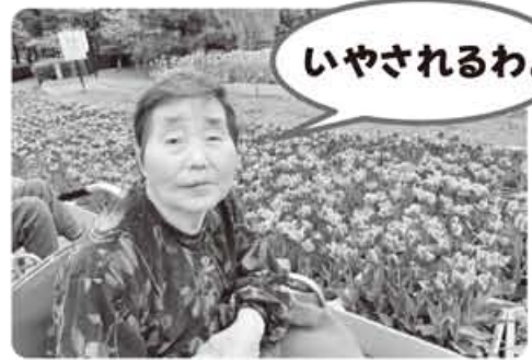
▲となみチューリップ