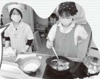
天ぷら揚げ立てでーす 厨房さんファイト!!