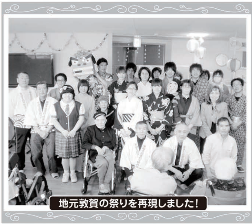
地元敦賀の祭りを再現しました!