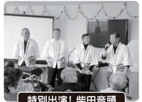
特別出演! 柴田音頭 市野々保存会の皆様