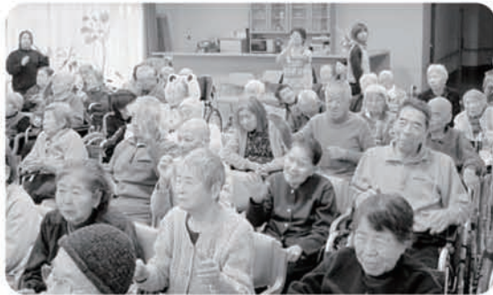
1月13日 若ふじ会の長い生き体操 ハイ 皆さん手振り良く！！