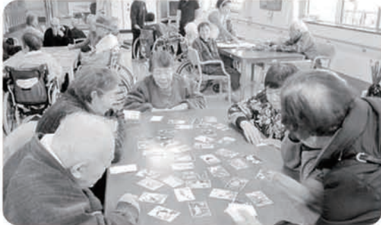
1月12日 萩の苑で「ぼっぼレク活動」 正月あそび カルタ取りです！！