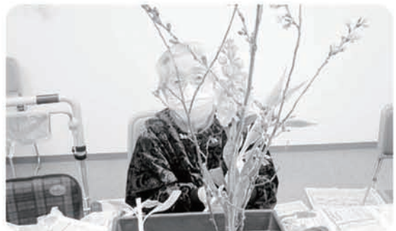
3月27日 生花サークル 92歳面代流家元です。お見事！！