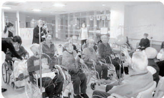
2月23日 同じく趣味活動 萩の苑ホールにて 「風船バレー」 どっちも頑張れ！！