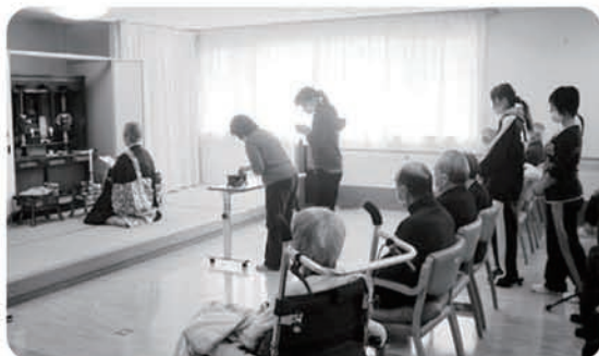
3月22日 春の彼岸法要 永覚寺ご住職により、 お経と説話がありました。焼香もしました！！