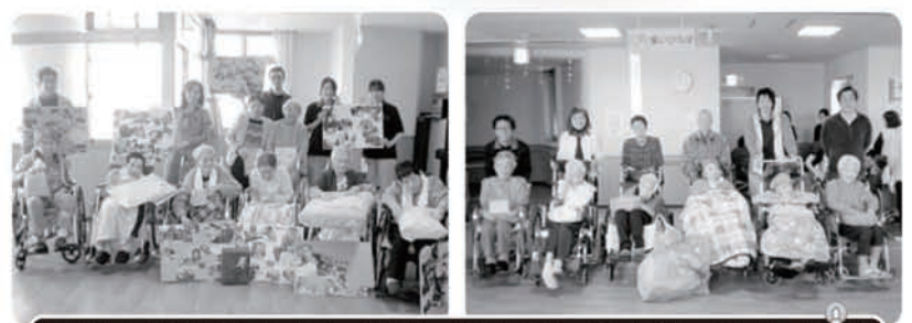
誕生日を迎えられた皆様、おめでとうございます!