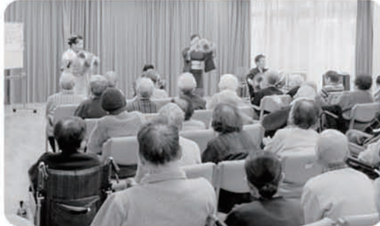
1月13日 若ふじ会が、ぼっぼでの 「初舞い」です！！