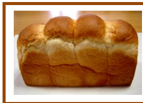
要予約 食パン 1本 ¥640