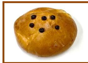
チョコレートパン ¥150