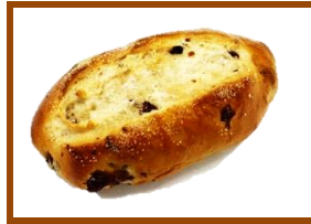
レーズンブレッド ¥130