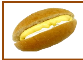
ミニコッペWクリーム ¥120