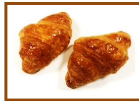
バタークロワッサン ¥120