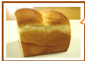
食パン 1斤 5枚スライス ¥320