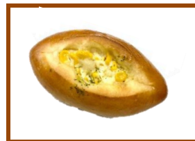
お得 北海道コーンパン ¥170 → ¥160