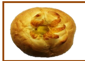
ダブルチーズパン ¥110