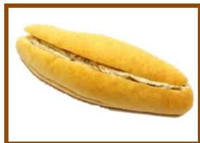
クッキーバニラフランス ¥150